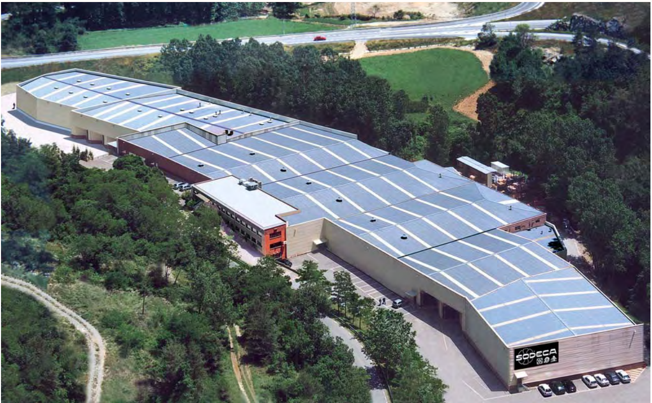
Factoría principal (10.650 m 2 )