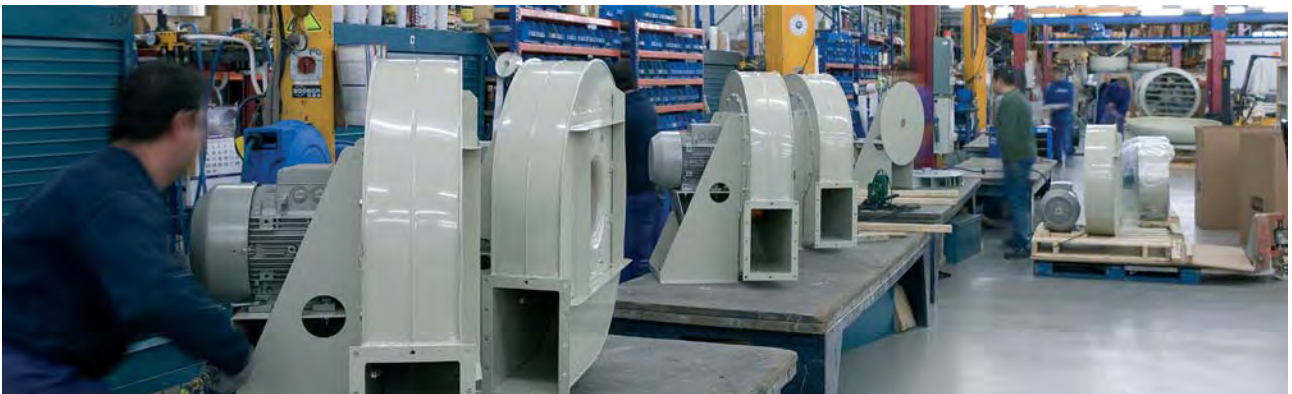
Montaje de ventiladores