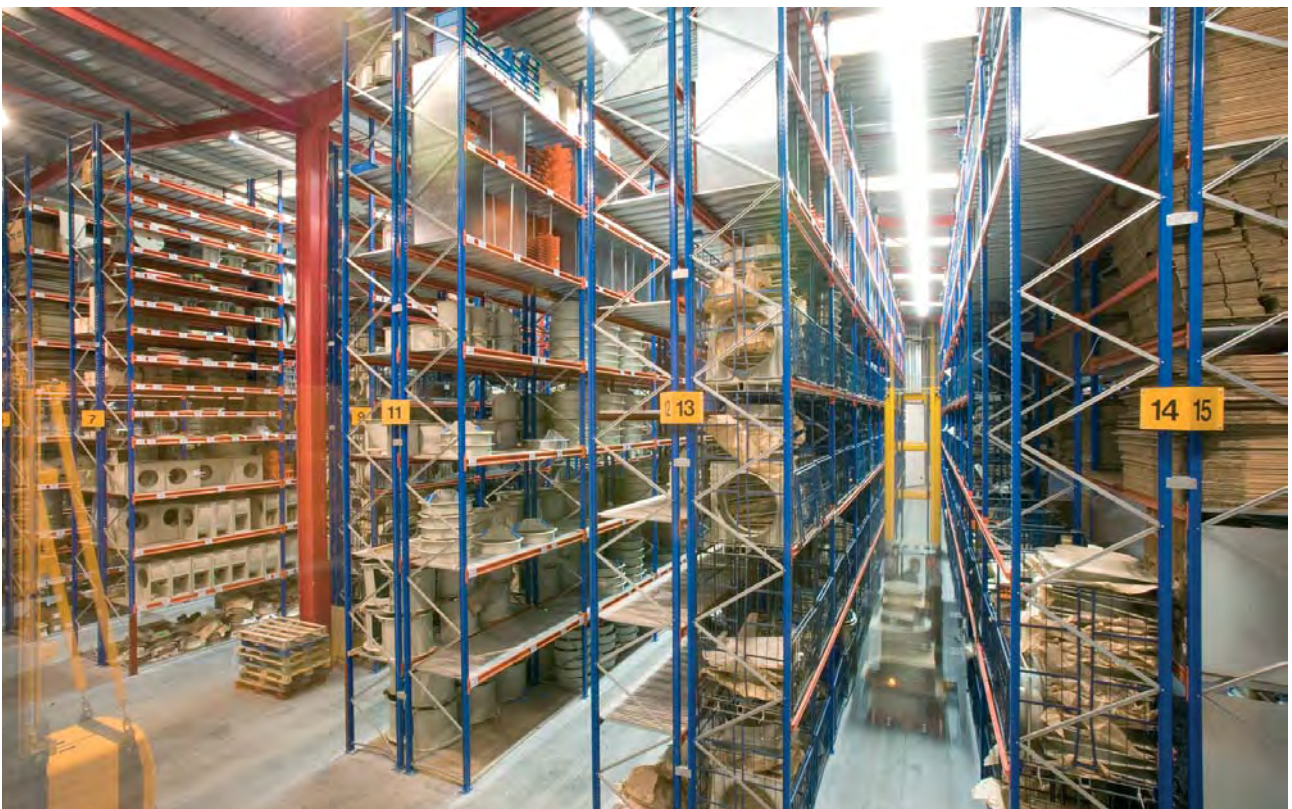
Almacén de componentes