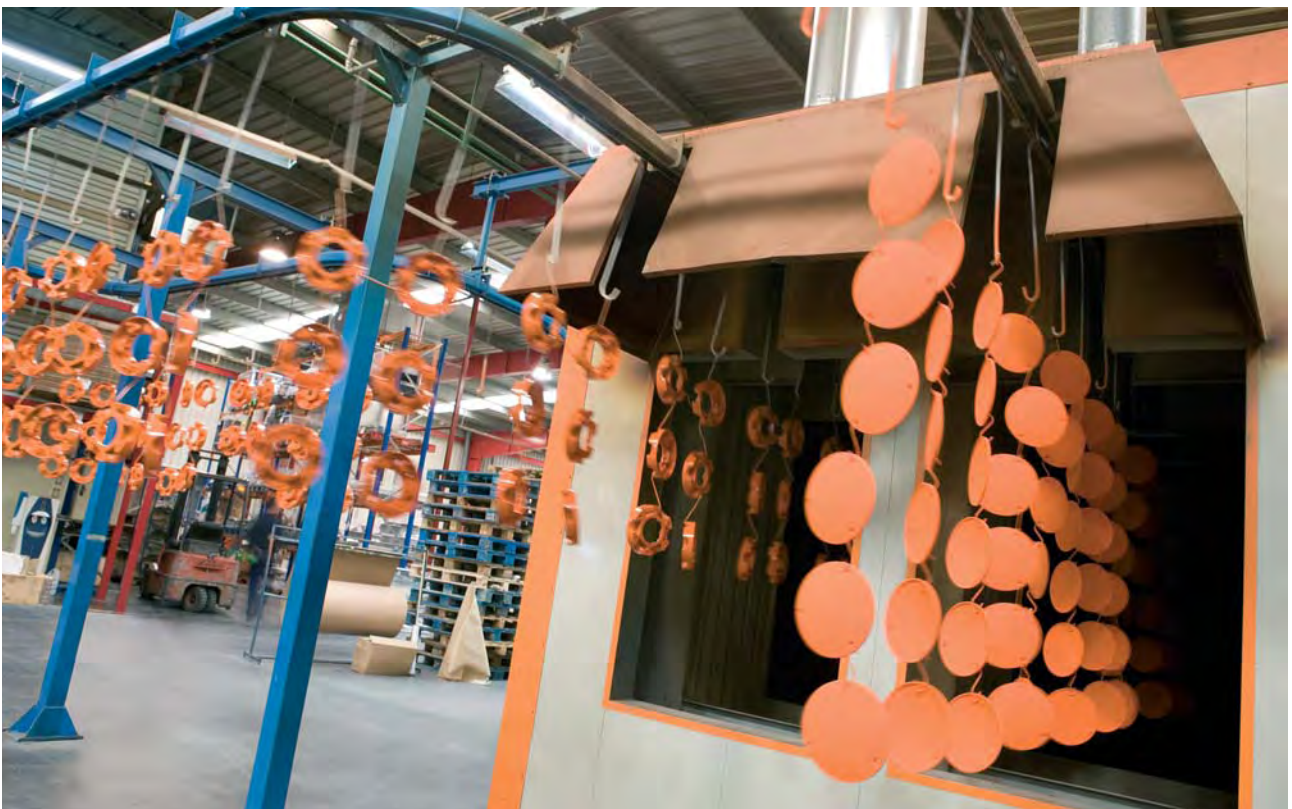
Línea automática de pintura