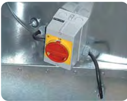
Interruptor de seguridad Serie INT incorporado en el extractor