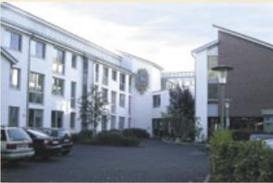
Referencia PRINETO : Clínica geriátrica Augustfehn