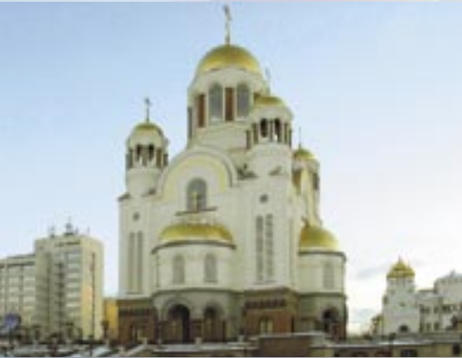
Referencia PRINETO : Capilla de los Zares Ekaterimburgo