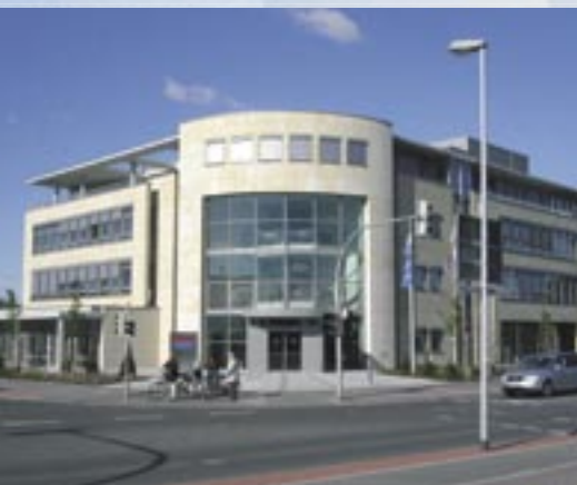
Referencia PRINETO : Oficinas de GSG Oldenburg