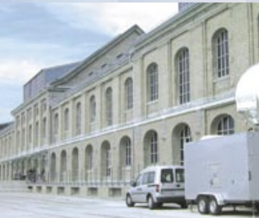
Referencia PRINETO : MTV Europe Berlin