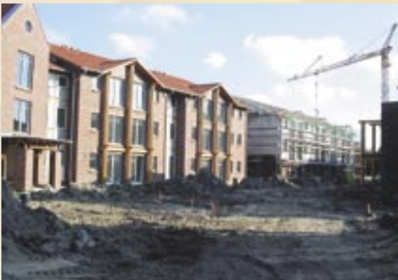
Referencia PRINETO : Parque de viviendas Hooksiel