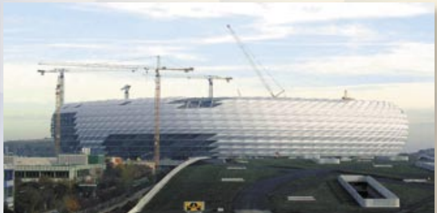
Referencia PRINETO : Allianz-Arena Munich