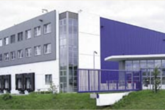
Referencia PRINETO : Rhenus Logistics Center