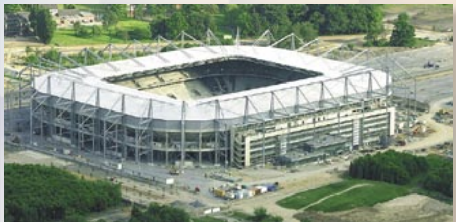
Referencia PRINETO : Borussia-Park Mönchengladbach