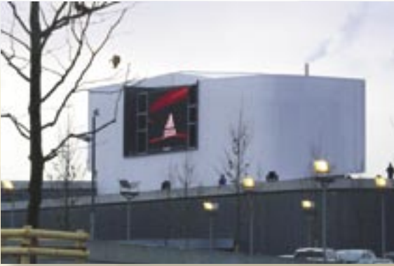
Referencia PRINETO : Adidas Factoryoutlet Herzogenaurach