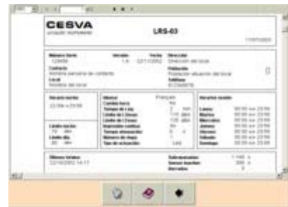
Generación de informes