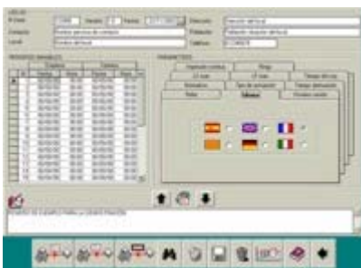
Programación del LRS-03