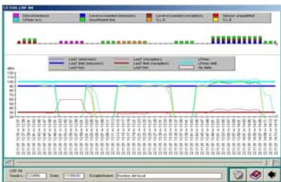
Visualización gráfica de datos (niveles sonoros e incidencias)