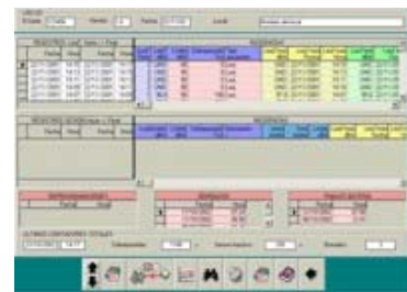
Visualización numérica de los datos (LeqT y registros de sesiones)