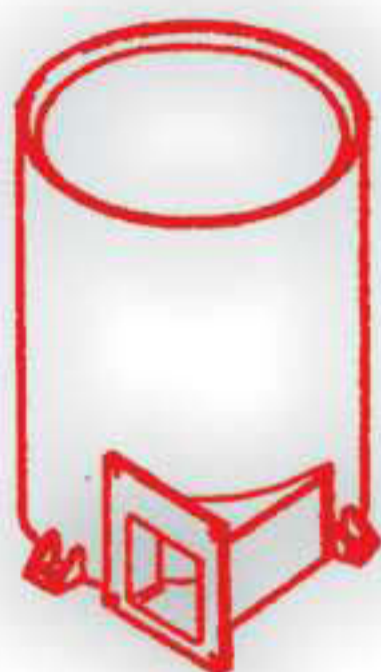
Cámara combustión P 2009. Modelo V1