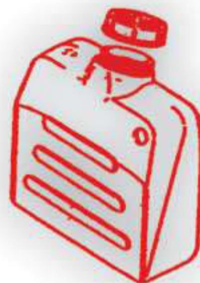
P 2023. Depósito gasoil