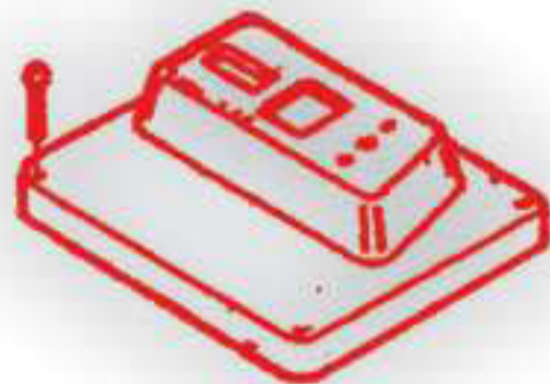
P 2028. Tapa caja eléctrica