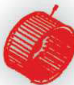
P 2008. Turbina