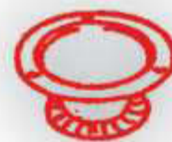
P 2021. Modelo V1-V3