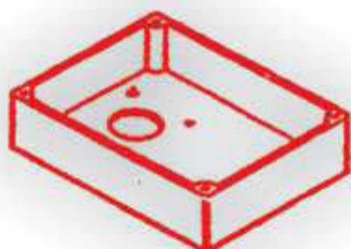
P 2031. Base caja eléctrica