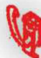
P 2018. Clip sujeción