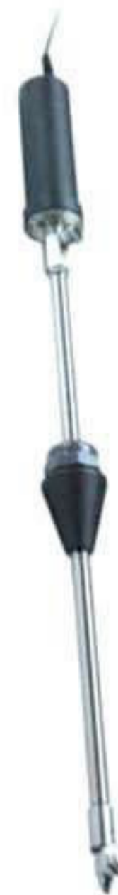
M 2071. Robot lavacisternas. Tensión: 12 v. Presión: 250 bar. Caudal: 21 l/m. Largo: 900 mm. Cabezal 2 boquillas M-4 Transformador 220-12 v.