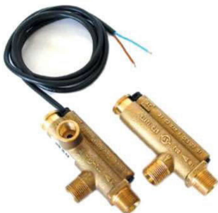
M 2068. Flusostato.