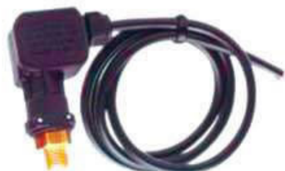
P 1027. Prensostato 220 v. 250 bar. Rosca 1/4".