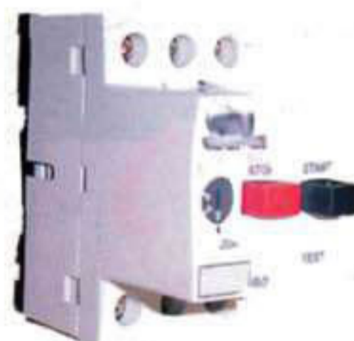
L 9001. Interruptor térmico 10-16.