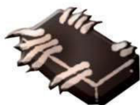
P 1023. Bloque temporización máquina y caldera.