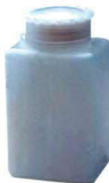
M 2070. Depósito 2 lts. anticalcáreo