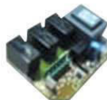
P 1063. Ficha TSI agua fría.