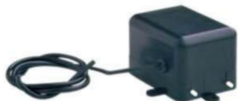
M 2069. Dosificador anticalcáreo 220 v.