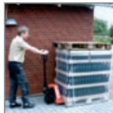
La Basic en la manipulación de botellas de cerveza.