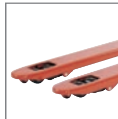
Disponibles con horquillas de una sola rueda ó en tandem.