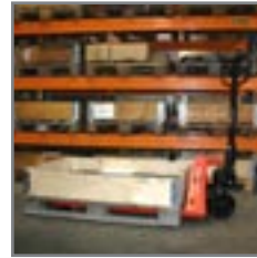
La Basic en la industria de componentes para la manipulación de cargas pesadas.