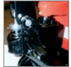
Sistema hidráulico a prueba de pérdidas de aceite altamente confiable.