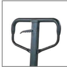
Timón recubierto de caucho que asegura un cómodo manejo.