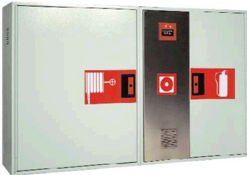
ARMARIO EXTINTOR + MÓDULO DE ALARMA para montarse con BIES 25/1 y 25/1S.

Elemento modular, que montado junto con las BIES-25, permite agrupar elementos de extinción por agua, con elementos de extinción con polvo/CO2, con elementos de alarma para formar CENTROS DE EXTINCIÓN Y ALARMA, siguiendo las últimas tendencias de centralizar todos los sistemas de protección contra incendios.