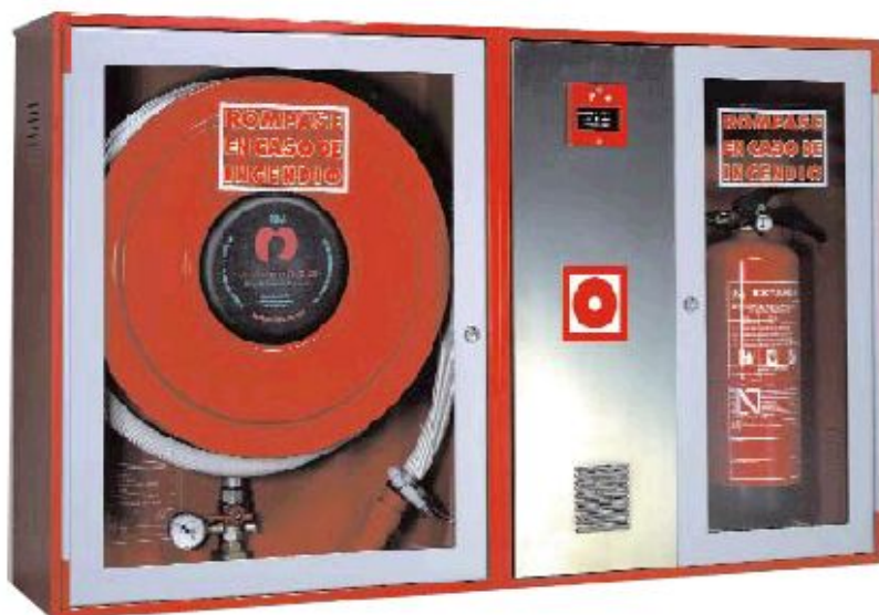
ARMARIO EXTINTOR + MÓDULO DE ALARMA para montarse junto con BIES 25/2 y 25/2S.

Elemento modular, que montado junto con las BIES-25, permite agrupar elementos de extinción por agua, con elementos de extinción con polvo/CO2, con elementos de alarma para formar CENTROS DE EXTINCIÓN Y ALARMA, siguiendo las últimas tendencias de centralizar todos los sistemas de protección contra incendios.