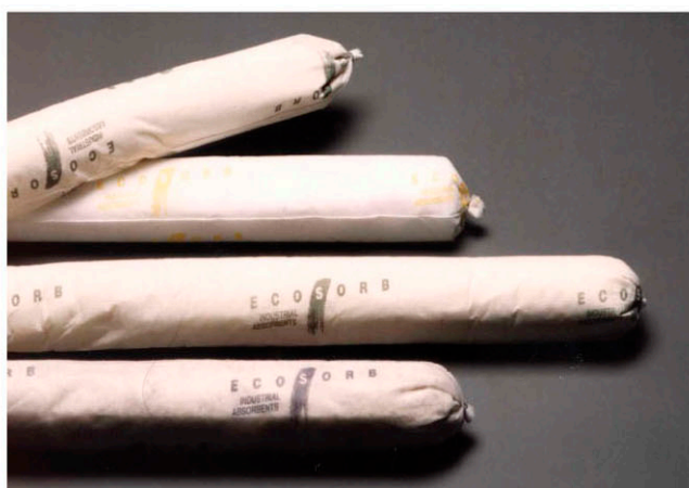
▶ TUBULAR ABSORVENTE