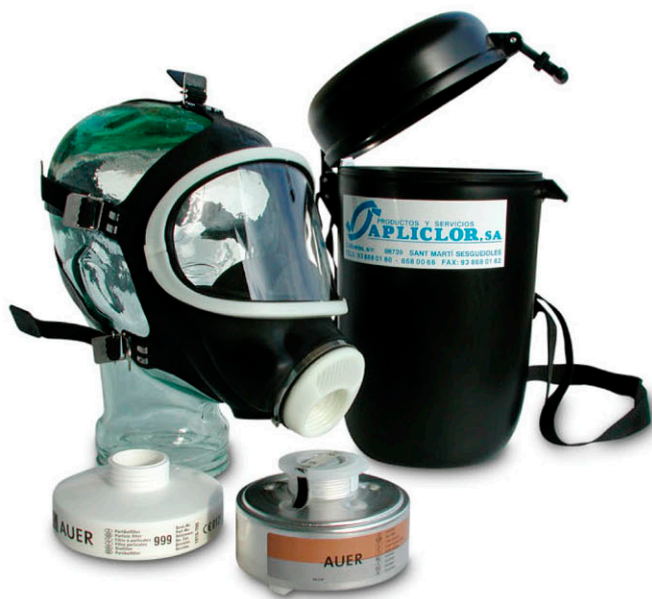
▶ MÁSCARA INTEGRAL "AUER 3 SE" CON ESTUCHE PROTECTOR - CE