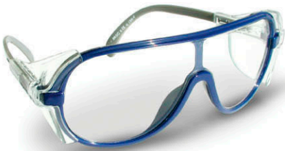
▶ GAFAS PROTECCIÓN PANORÁMICAS CE