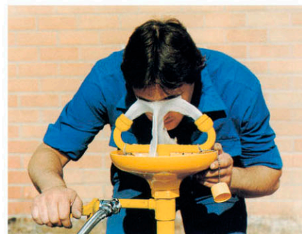
▶ LAVAOJOS DE EMERGENCIA