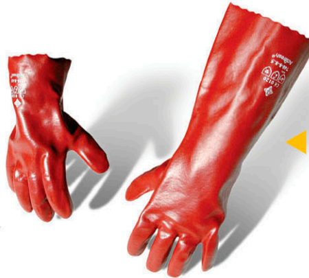
▶ GUANTES DE PVC ANTIÁCIDO - 27/40 cms. CE