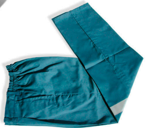
▶ PANTALÓN MERAKLON