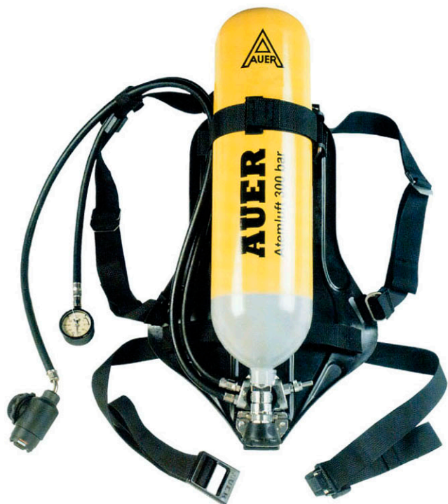
▶ EQUIPO AUTÓNOMO - CE