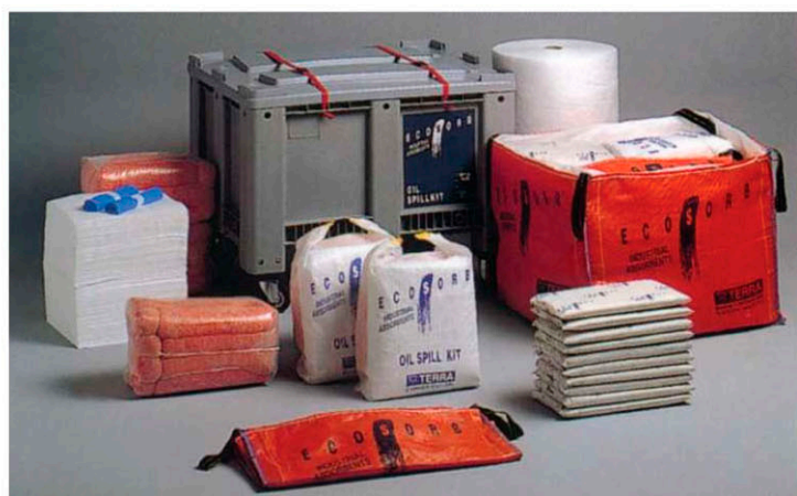
▶ KIT DE EMERGENCIA