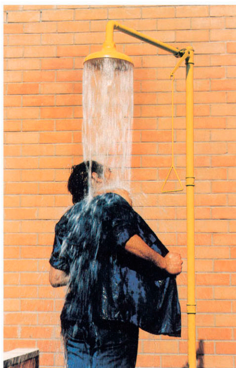
▶ DUCHA LAVAOJOS DE EMERGENCIA