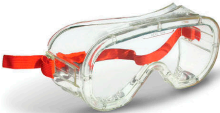
▶ GAFAS PROTECCIÓN MONOPIEZA - CE