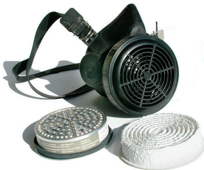
▶ MÁSCARA TRILIX - CE