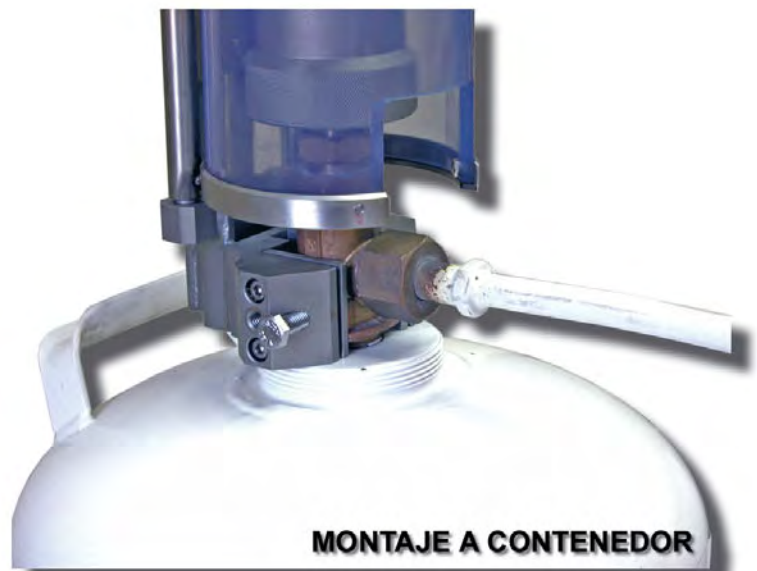
MONTAJE A CONTENEDOR

Se suministra un motor neumático accionado por aire comprimido a través de un compresor y un pulmón receptor. El compresor proporciona una presión constante y predeterminada alrededor de 7 bares, suficiente para producir la rotación del eje a las revoluciones necesarias para llevar el volante desde la posición de apertura hasta la posición de cerrado. Los motores neumáticos están conectados al pulmón receptor a través de válvulas normalmente abiertas y una válvula de control de presión, normalmente cerrada. Es por ello que durante el normal funcionamiento de las botellas de cloro, las válvulas de dichas botellas están abiertas y los motores neumáticos están aislados del acumulador a través de la válvula de control de presión.