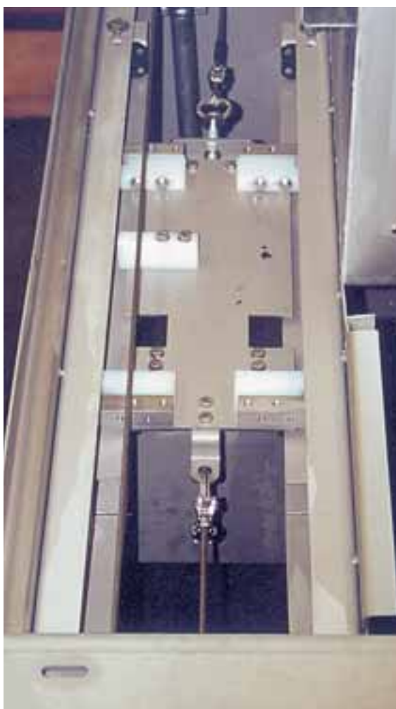
Rasqueta para eliminación de grasas.

Una característica única de la planta compacta ROTAMAT® es el montaje de una rasqueta que desplaza las grasas por la superficie del desengrasador hacia la aspiración de la bomba de grasas. La rasqueta se acciona mediante un cable. Como se consiguen eliminar todas las grasas flotantes, se evita la degradación anaerobia y con ello los problemas de malos olores.