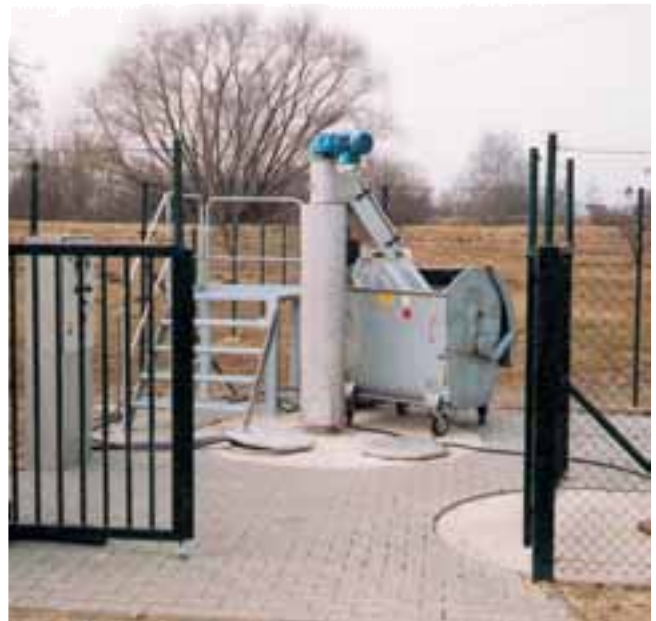
Versión con aislamiento para instalación exterior