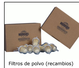
Filtros de polvo (recambios)