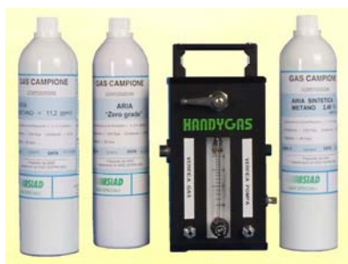
Handygaz, para calibración diaria del Metrex3