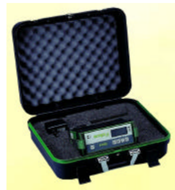
Set METREX 2 completo