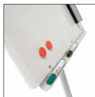
Pizarra móvil lacada (magnética) Laquered mobile flipchart (magnetic)