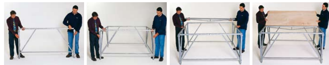
1 - Encaje del marco sobre los postes de rosca. 2 - Ensamblaje del marco y postes para formar los módulos de 2 x 2 m. Ajuste de las roscas. 3 - Colocación del travesaño soporte de las planchas. 4 - Colocación del suelo.

Solicite nuestro catálogo de podios y tribunas