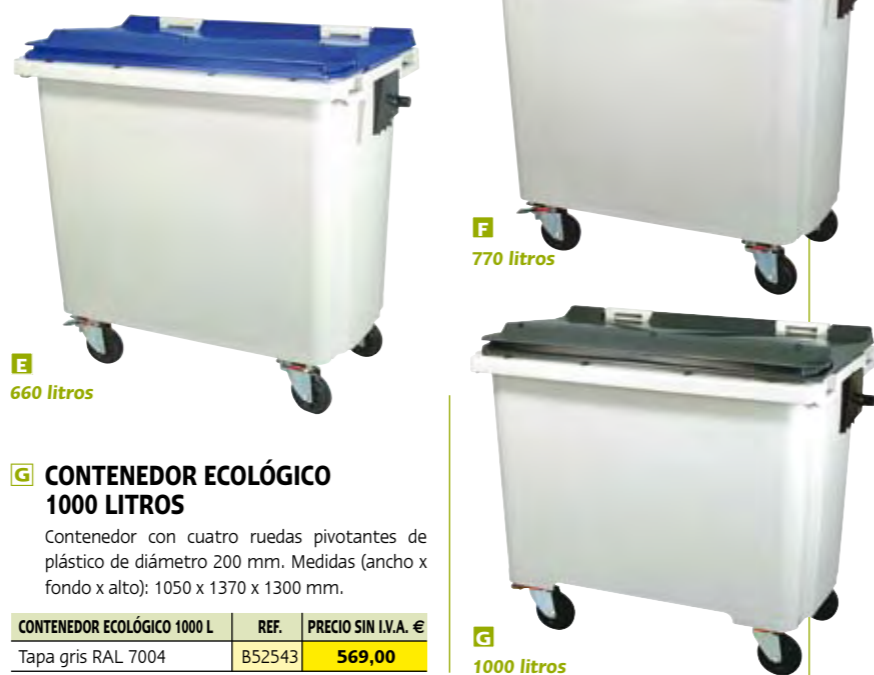
E 660 litros