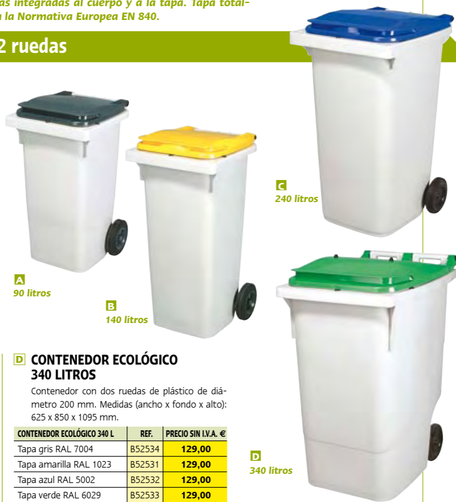
A 90 litros