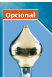
Opcional Pomo de plástico dorado.