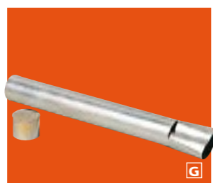
Caja de anclaje.

MÁSTIL ECO 6 METROS Mástil en acero lacado en poliéster blanco. Suministrado completo. Resiste hasta vientos de 100 km/h. Medidas máximas de la bandera recomendada: 80 x 120 cm. Altura total: 6 m. Altura fijado al suelo: 5,40 m