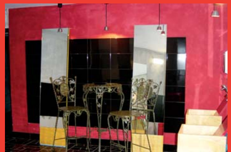
El porcelánico es su material predilecto.