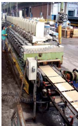
Parte de la sección.