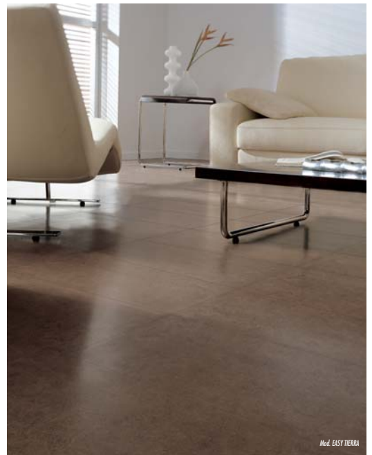
Mod. EASY TIERRA

Su textura facilita desde decoraciones clásicas hasta modernos lofts. Sin duda una propuesta a tener en cuenta al estar disponible además en formatos: 300x600, 400x400 mm y en una pieza ranurada denominada STRIP que facilita la decoración a tiras de 120x300 mm en pieza de precorte de 300x600 mm.