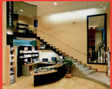
Camilo usa la cerámica en sus proyectos.