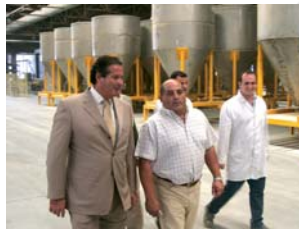
Un paseo por los silos lesguindos.