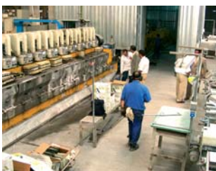
La sección de pulido.