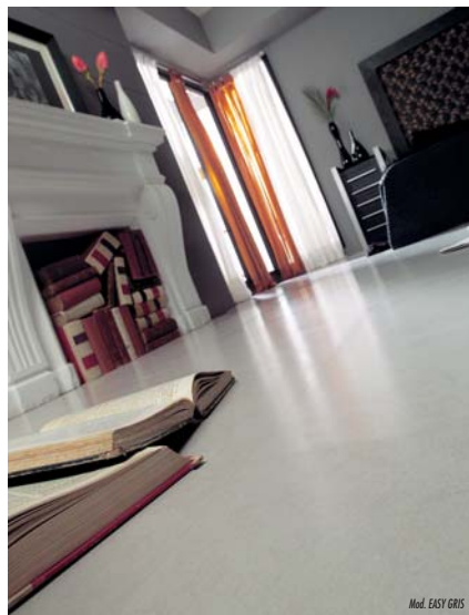
Mod. EASY GRIS

Grisos oscuros y claros, junto a marrones y verdes sombríos, destacando los tonos cremas que son imprescindibles en cualquier proyecto.