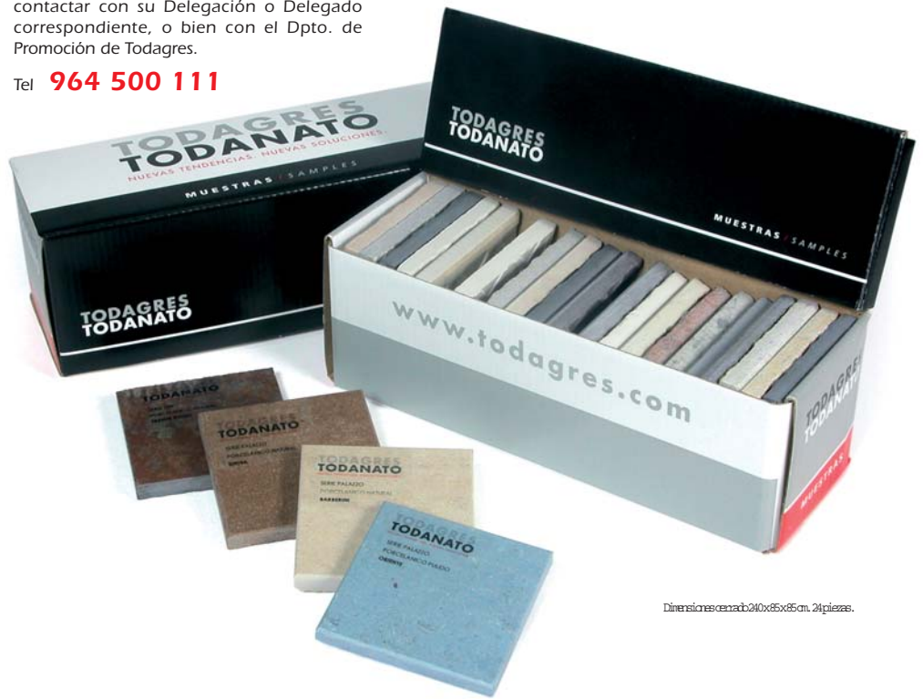
Dimensiones cerrada: 240x85x85mm, 24 piezas.

Seguimos recibiendo fotos. Animate y participa