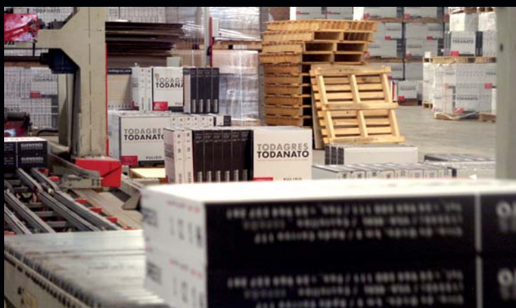
Palatizado de cajas.