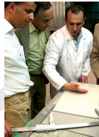
Una visita para no olvidar.

La experiencia, a tenor de los comentarios, está siendo muy gratificante para todas las visitas que han pasado por esta experiencia. Repitiendo incluso algunas de ellas con distintos acompañantes, como constructores, arquitectos y decoradores.