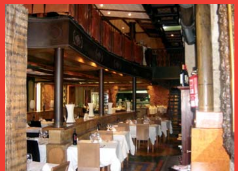
Un éxito imparable.