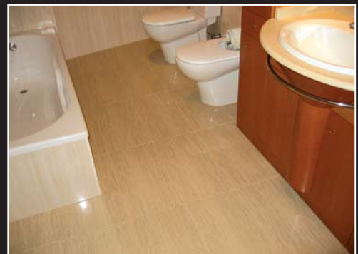
Foto seleccionada: Joaquín Pérez (Requena - VALENCIA). Material utilizado: 300 x 600 DAFNE ORO PULIDO.