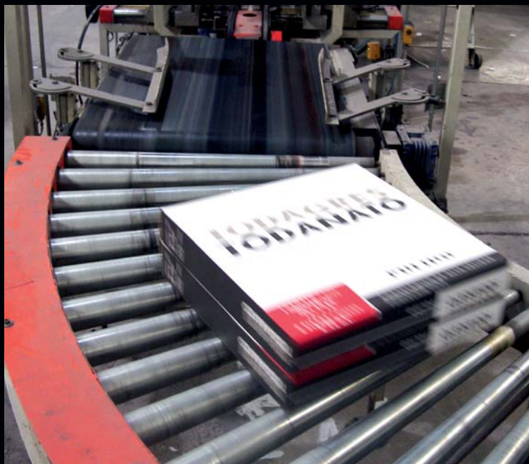
Encajado de piezas.

“El acabado pulido lejos de apagarse con las nuevas propuestas sigue en aumento”