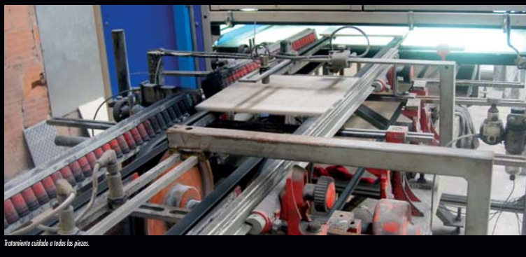
Tratamiento cuidadoso a todas las piezas.