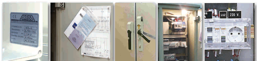
Placa características, marcado CE