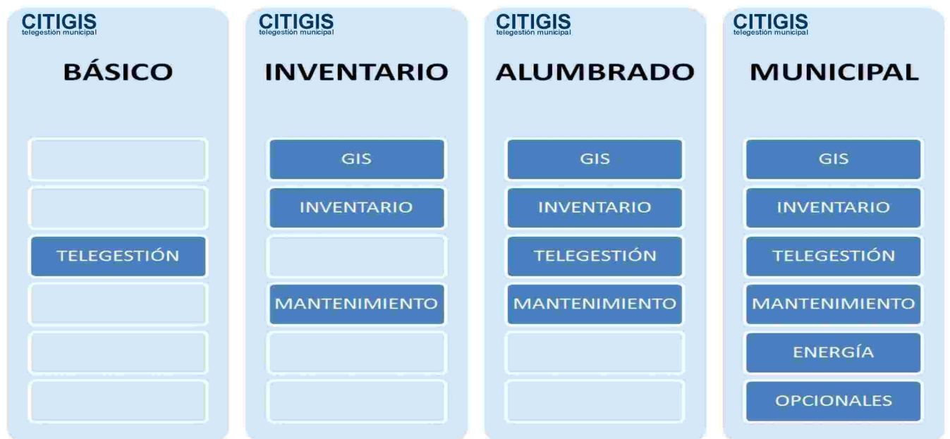
Versiones del software.