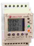
Analizador de red.