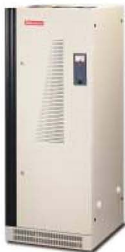
Modelo RET 150-4

Hacia 1974, SALICRU, consciente de esta problemática, patenta y fabrica el primer estabilizador completamente electrónico del mercado: el RE , de tecnología que ha sido y es, un referente para el resto de fabricantes mundiales, destacando por aunar las ventajas de las dos tecnologías imperantes, pero sin sus inconvenientes. Tal innovación ha permitido extender el alcance de esta tecnología a aplicaciones, entonces inimaginables, y que hoy son habituales en multitud de procesos industriales.