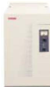
Modelo RET 9-4