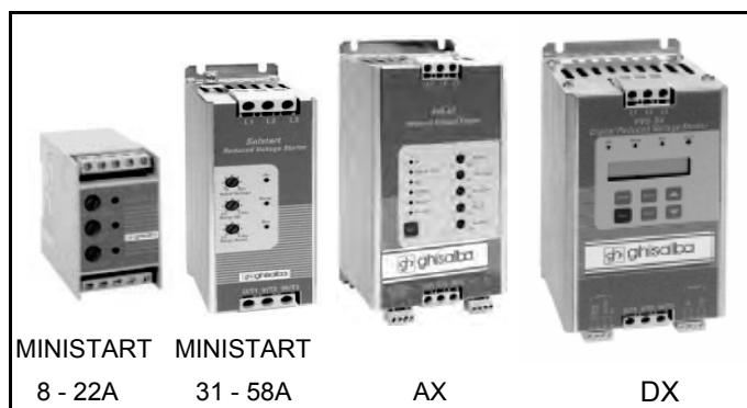
MINISTART 8 - 22A MINISTART 31 - 58A