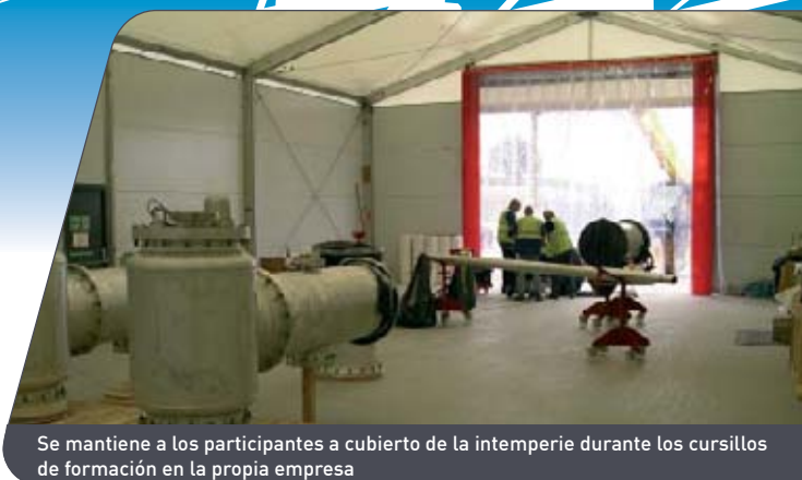
Se mantiene a los participantes a cubierto de la intemperie durante los cursillos de formación en la propia empresa