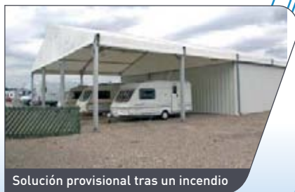
Solución provisional tras un incendio

Ambas cosas son posibles y se lograrán con la ayuda de Spaciotempo®. En una emergencia hemos sido capaces de dejar nuestros pabellones instalados y en condiciones de funcionamiento en 48 horas. Éste es un hecho a cuyo logro contribuye considerablemente el ligero (pero robusto) armazón de aluminio de sencilla estructura modular que puede ser fácilmente transportado e instalado con rapidez.