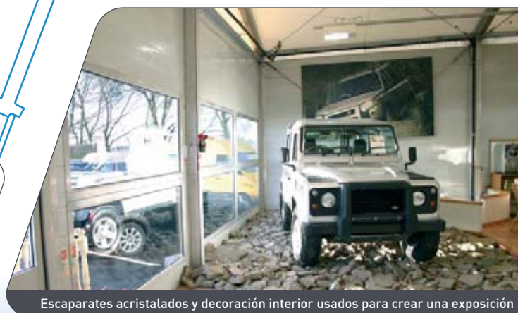
Escaparates acristalados y decoración interior usados para crear una exposición

Spaciotempo® puede proporcionar instalaciones temporales adaptadas a cualquier tipo de necesidades específicas en materia de formación. Para crear un ambiente confortable, nuestra cubierta térmica reduce el ruido, mientras que varias opciones de revestimiento exterior de las paredes facilitan el aislamiento.