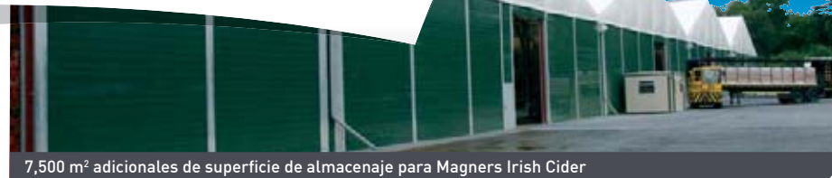
7,500 m 2 adicionales de superficie de almacenaje para Magners Irish Cider

En colaboración con Vd., le ayudaremos a desarrollar y ampliar las dimensiones de su empresa de acuerdo con las cambiantes tendencias y demandas de los mercados actuales.