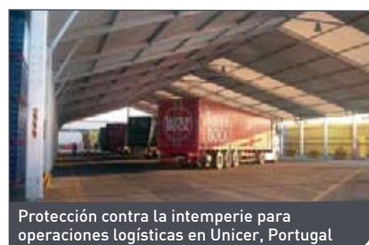
Protección contra la intemperie para operaciones logísticas en Unicer, Portugal

Nuestros pabellones pueden ser alquilados por periodos de 1 mes hasta 20 años, y pueden ser fácilmente adaptados a las cambiantes necesidades de su empresa mediante las pertinentes modificaciones, ampliaciones, reducciones y reubicaciones. Después de todo, una empresa flexible es una empresa saneada.