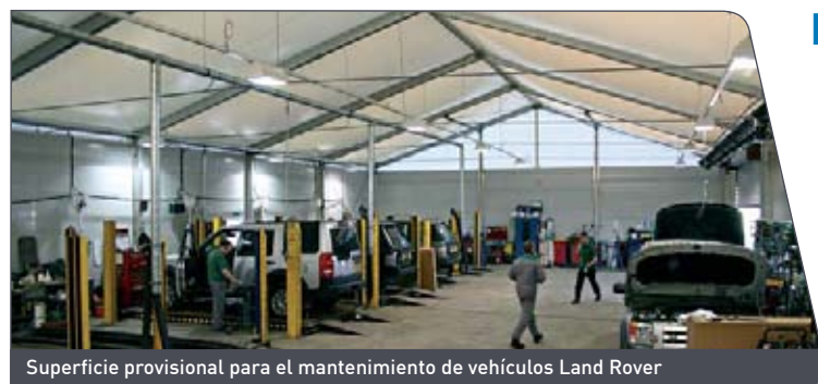
Superficie provisional para el mantenimiento de vehículos Land Rover