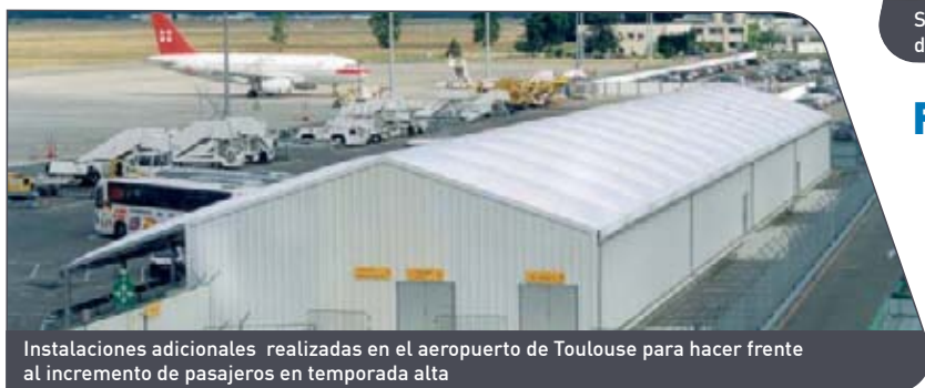
Instalaciones adicionales realizadas en el aeropuerto de Toulouse para hacer frente al incremento de pasajeros en temporada alta