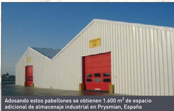
Adosando estos pabellones se obtienen 1.600 m 2 de espacio adicional de almacenaje industrial en Prysmian, España