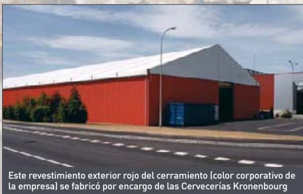
Este revestimiento exterior rojo del cerramiento (color corporativo de la empresa) se fabricó por encargo de las Cervecerías Kronenbourg