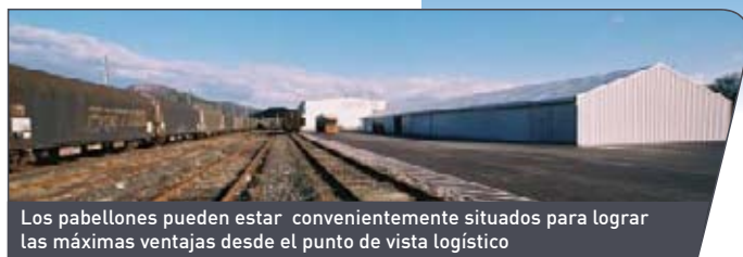
Los pabellones pueden estar convenientemente situados para lograr las máximas ventajas desde el punto de vista logístico

NUUESTRO SISTEMA DE INTERCONEXIÓN REDUCE DRÁSTICAMENTE EL TIEMPO DE MONTAJE, LO CUAL LE ASEGURA QUE SU PABELLON QUEDARÁ LISTO Y EN CONDICIONES DE FUNCIONAMIENTO EN UNOS POCOS DÍAS.