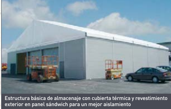
Estructura básica de almacenaje con cubierta térmica y revestimiento exterior en panel sándwich para un mejor aislamiento