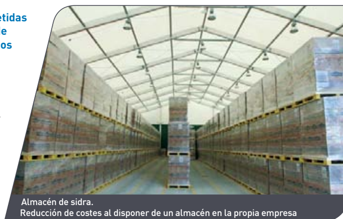
Almacén de sidra. Reducción de costes al disponer de un almacén en la propia empresa

Con Spaciotempo® podrá rápidamente aumentar su superficie de almacenaje. Desde el almacén básico hasta un espacio con temperatura controlada; disponemos de un extenso stock de material para dar respuesta inmediata a su demanda. Nos adaptamos a sus necesidades mediante opciones de cerramientos perimetrales y distintos tipos de cubiertas. Adosando nuestros pabellones puede disponer de una selección ilimitada de pórticos y longitudes, que le permitirá crear y modular el espacio hasta el infinito (de 5 a 40 metros de anchura, longitud ilimitada en múltiplos de 5 m, altura lateral en punto mínimo hasta 8 m).