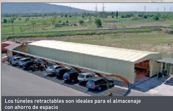
Los túneles retractables son ideales para el almacenaje con ahorro de espacio