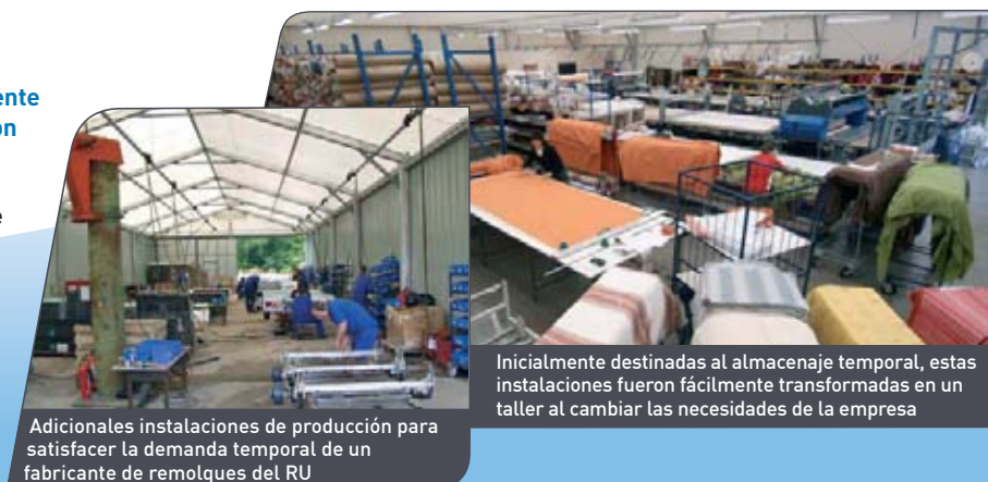
Adicionales instalaciones de producción para satisfacer la demanda temporal de un fabricante de remolques del RU

El diseño modular básico de Spaciotempo® puede adaptarse fácilmente para crear unas óptimas instalaciones de producción. El trabajo de producción puede desarrollarse en condiciones de alta luminosidad natural proporcionada por la cubierta de PVC blanco semitranslúcido, o artificial, a través de una gama de opciones de iluminación, climatización, calefacción... Puede además implementarse la clásica línea de producción estableciendo rutas opuestas de entrada y salida.