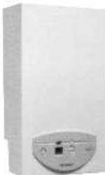
Celsius Plus WTD