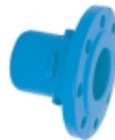
Ref. NL 41 Brida