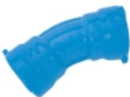
Ref. NL 30 Codo 90° Ref. NL 32 Codo 45° Ref. NL 33 Codo 30° Ref. NL 34 Codo 22°