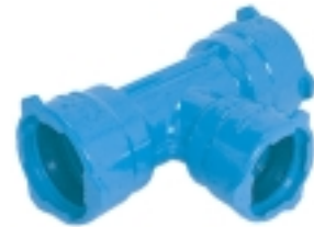
Ref. NL 20 Combi-T