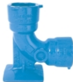
Ref. NL 60 Codo con pie