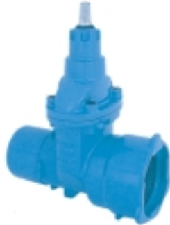
Ref. NL 00 Válvula