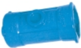
Ref. NL 50 Collarín sin rosca Ref. NL 51 Collarín con rosca