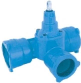
Ref. NL 10 Combi-T con válvula integrada