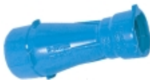
Ref. NL 40 Reducción