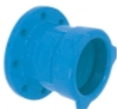
Ref. NL 42 Enchufe brida