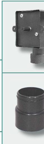
Prolongación para toma inox 2,5cm cod. SD801