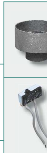
Microrruptor cod. SD903