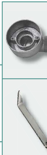
Llave de apertura para para toma aspiración cod. SD919