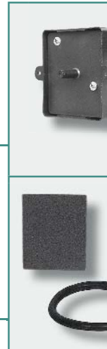
Junta para tapa cod. C8601 Arandela para toma inox cod. C8602