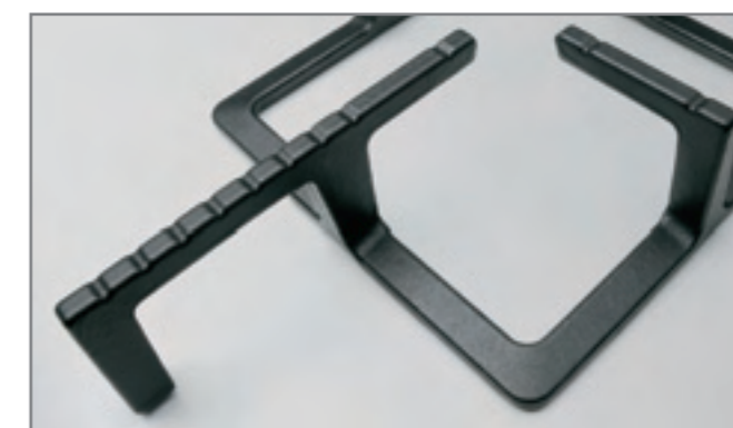
Parrilla de fundición de robusto diseño que se incorpora en las placas de gas, dando una gran estabilidad a recipientes grandes y pequeños.