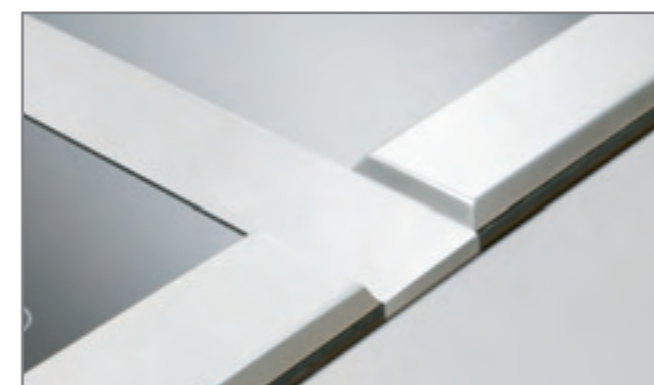
El perfil de unión decorativo de aluminio anodizado aporta un agradable detalle de diseño a la combinación de varios Dominós.