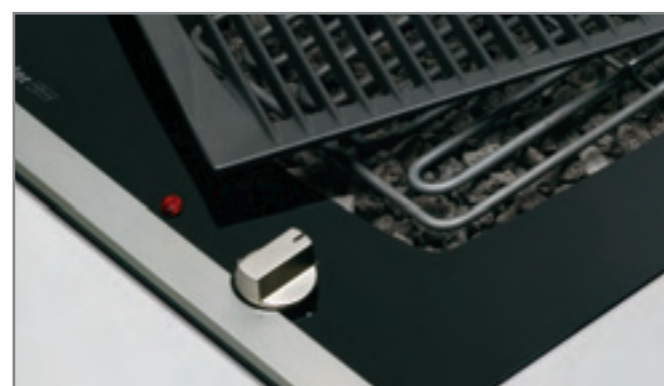
Una parrilla para cocinar sin grasas. Una resistencia bajo la cual las piedras volcánicas distribuyen uniformemente el calor.