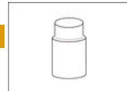
Reducción MH 243/Manchon MF réduit 243/Reducing Coupler MF 243