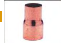
Reducción HH 240/Manchon FF réduit 240/Reducing Coupler FF 240