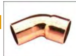
Codo radio corto MH 92/Coude MF 92/Elbow MF short 92