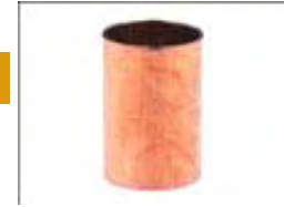
Manguito 270/Manchon 270/Coupler 270