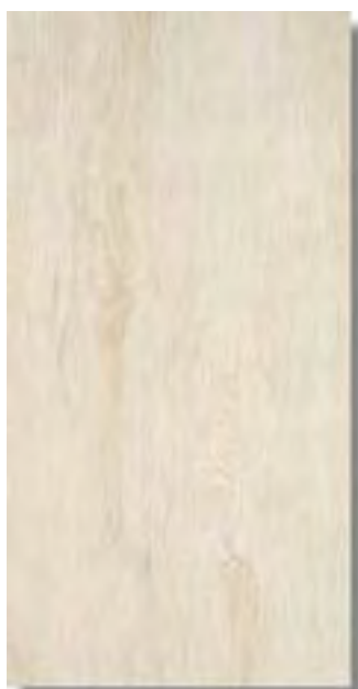
Sabika Blanco W36 PEI IV A43 Sabika Blanco Rec W40 PEI IV A48