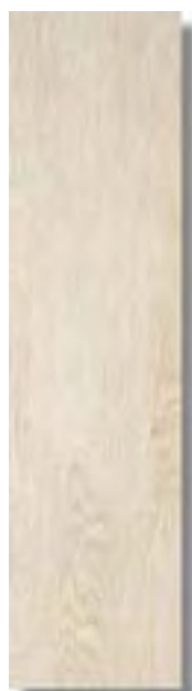
Sabika Blanco Rec 15 x 60 cm. HZE A61