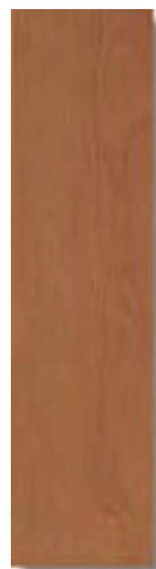
Sabika Cerezo Rec 15 x 60 cm. HZF A61