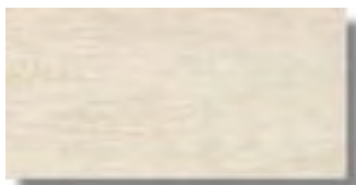
Sabika Blanco Rec 15 x 30 cm. HZB A61