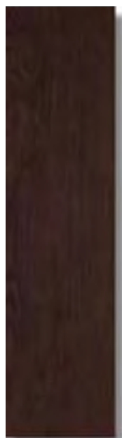
Sabika Wengé Rec 15 x 60 cm. HZG A61