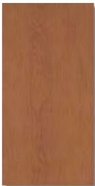
Sabika Cerezo W37 PEI III A43 Sabika Cerezo Rec W41 PEI III A48