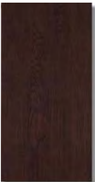
Sabika Wengé W38 PEI III A43 Sabika Wengé Rec W42 PEI III A48