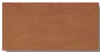
Sabika Cerezo Rec 15 x 30 cm. HZC A61