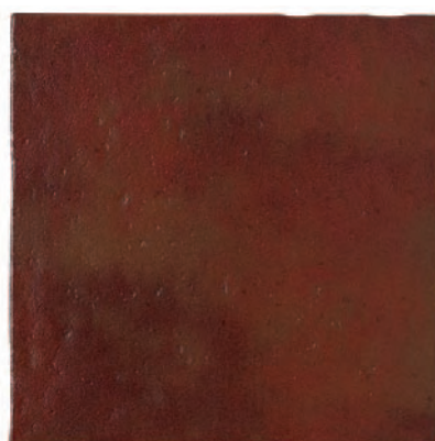
Rauda Rojo 1HD PEI III R14