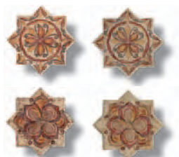
Rauda Estrella 6 x 6 cm. VOL R52