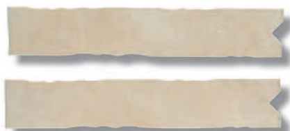
Rauda Blanco Listelo Estrella 6 x 33,3 cm. VOO R57