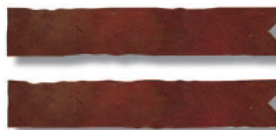
Rauda Rojo Listelo Estrella 6 x 33,3 cm. VOP R57