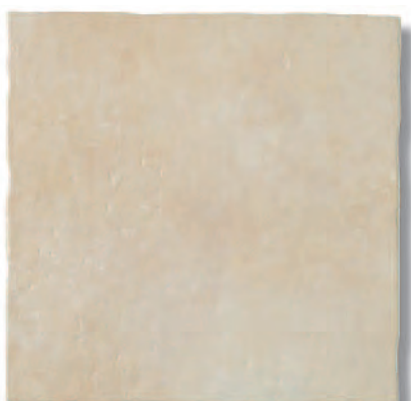
Rauda Blanco 1HE PEI IV R14