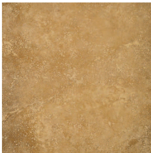
Lauro Gold WIZ