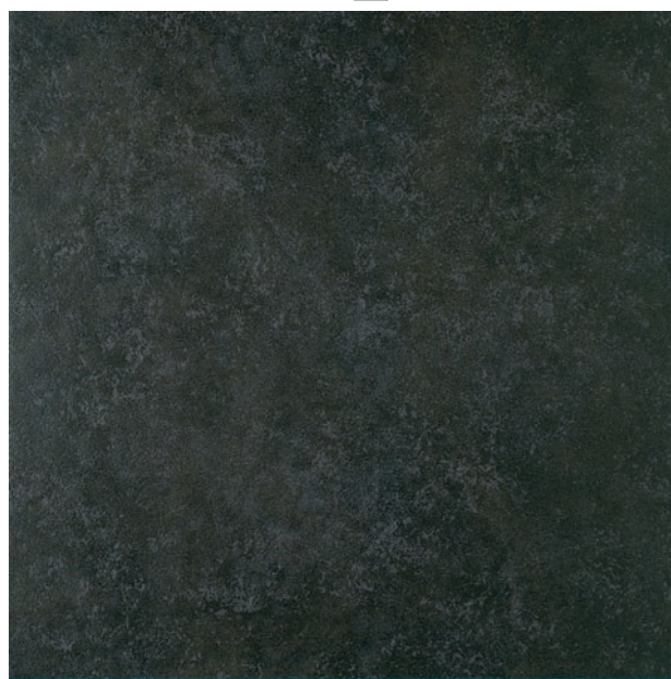
Lauro Negro WJ1