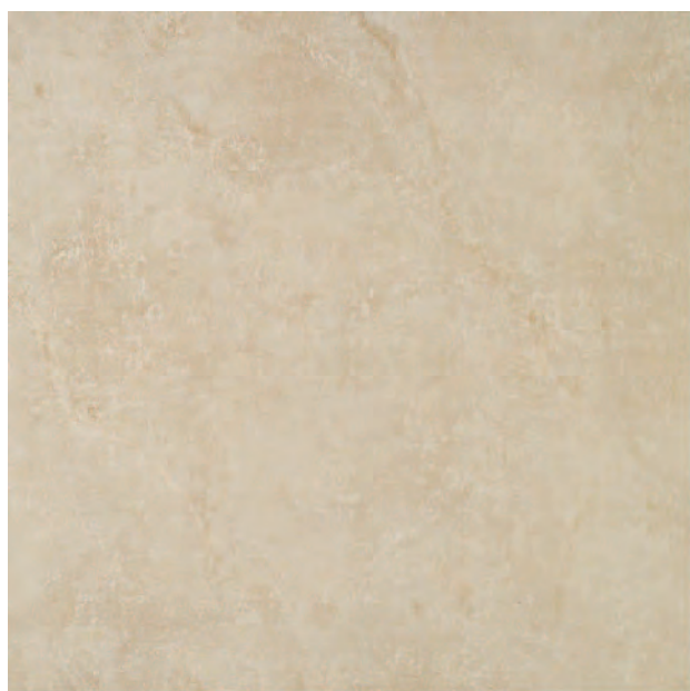
Lauro Beige WIY