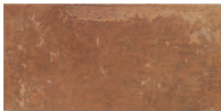
Darro Cuero W34 PEI III A40 Darro Cuero Ar W72 PEI III / R11 A42