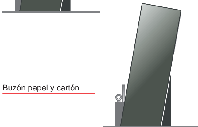
Buzón papel y cartón