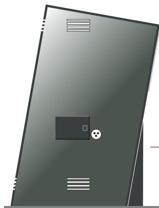
Buzón basura doméstica