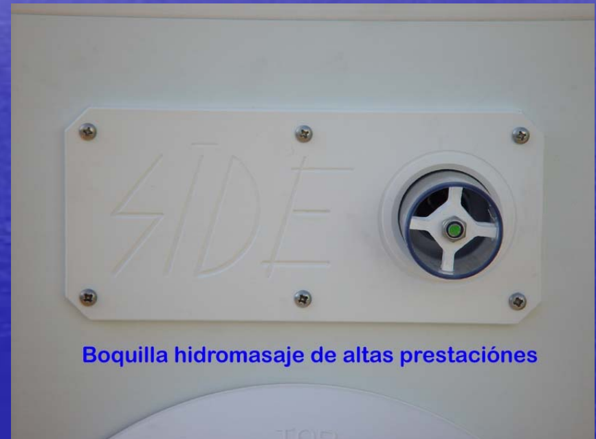
Boquilla hidromasaje de altas prestaciones