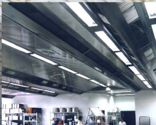
TECHO FILTRANTE CERRADO