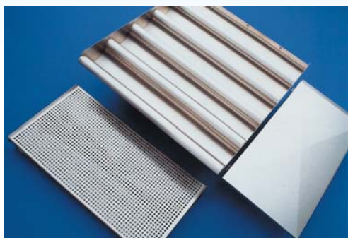
Detalle de componentes del techo filtrante