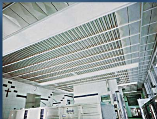
TECHO FILTRANTE ABIERTO