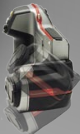
Unidad de lente inclinable