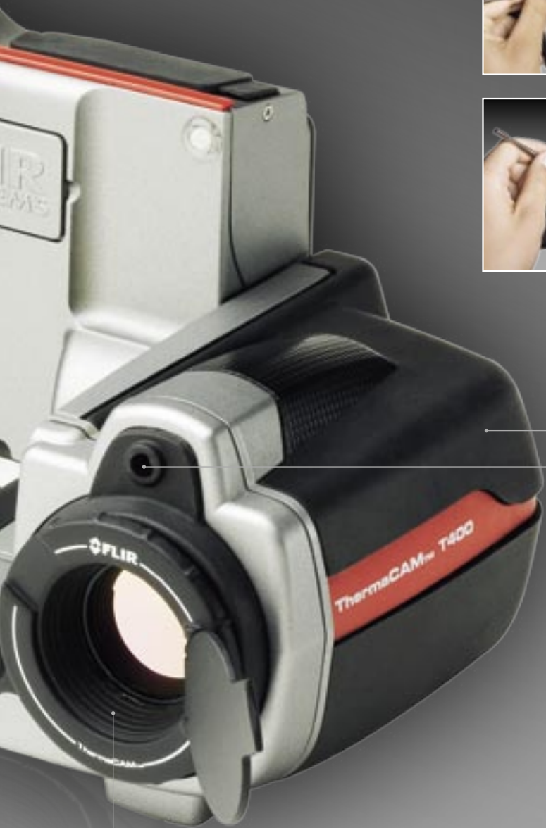
Unidad de lente inclinable