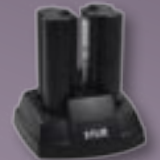
Cargador de batería