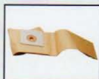
BOLSA PAPEL PAPER BAG SAC DU PAPIER AY - 3600 - IND y AY - 2400 - IND COD.: 587100