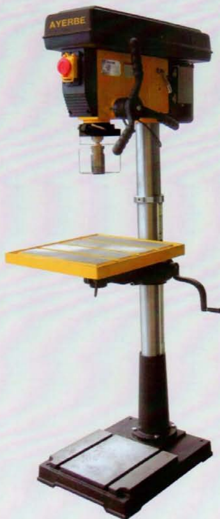
AY - 32 - TC MN