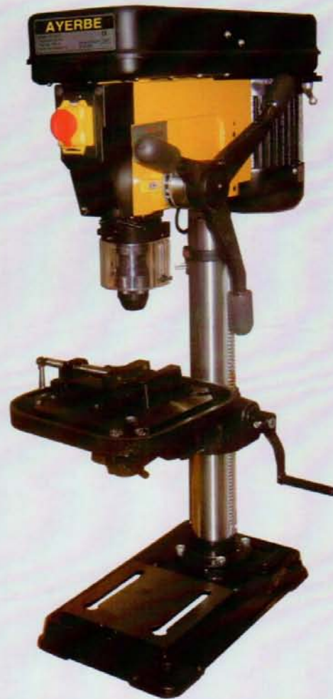
AY - 13 - TS