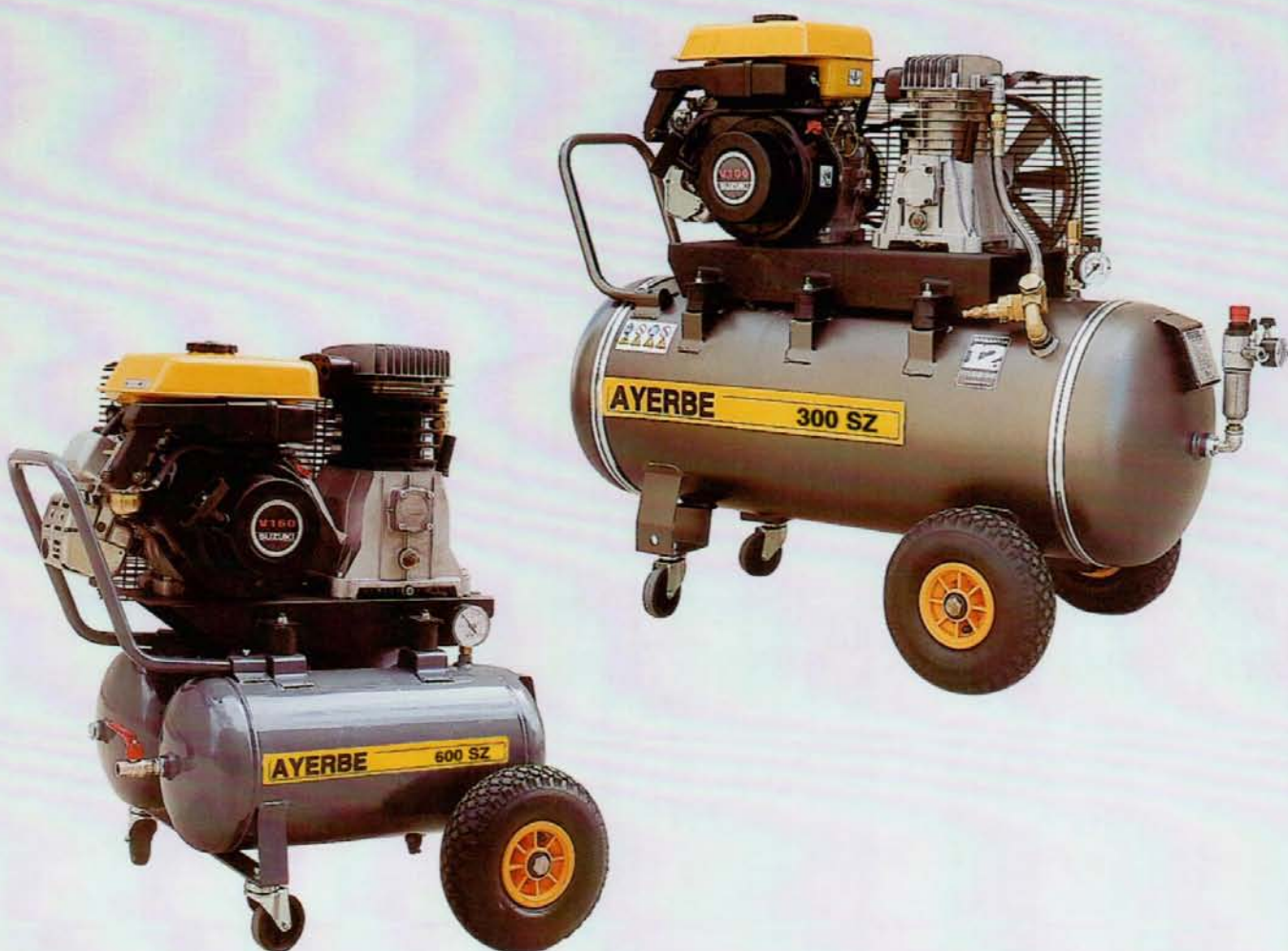
AY - 300 - SZ