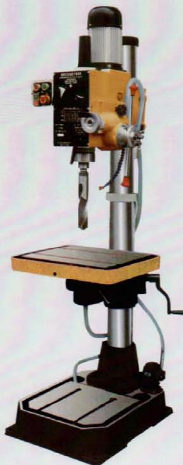
AY - 40 TS