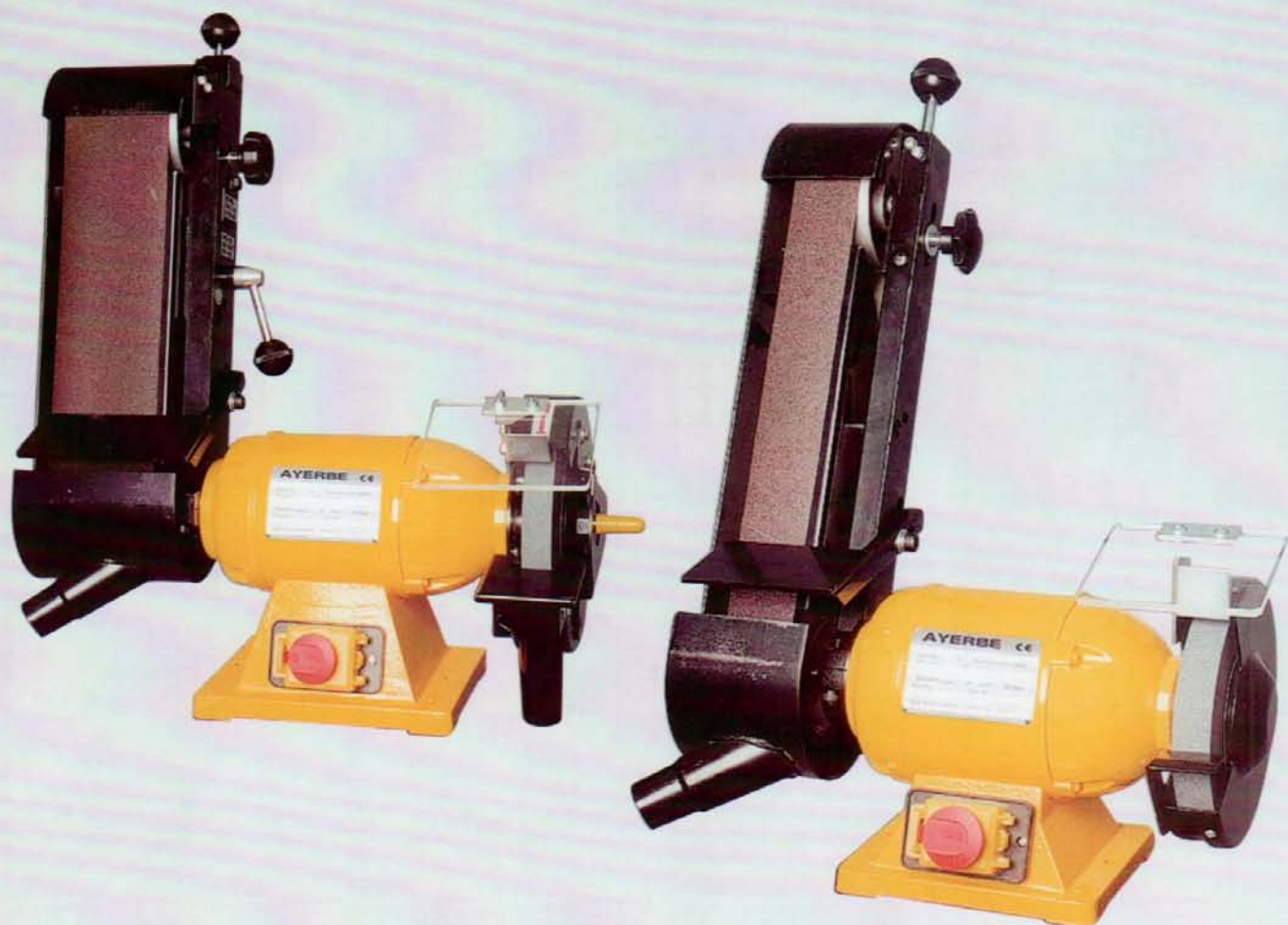
AY - 150 PROF LJ