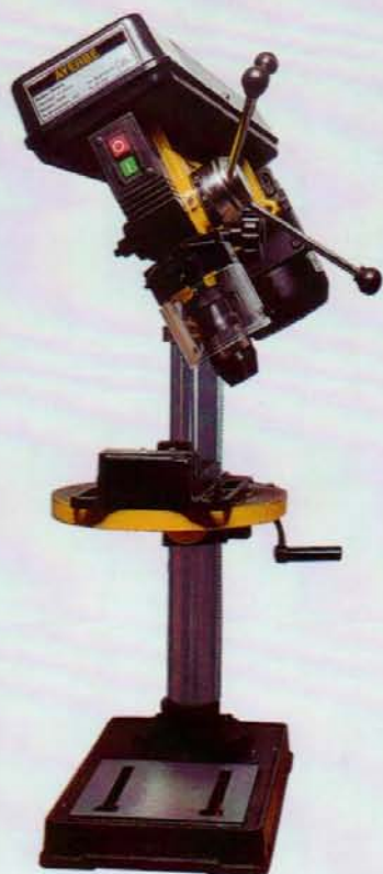
AY - 16 - CG