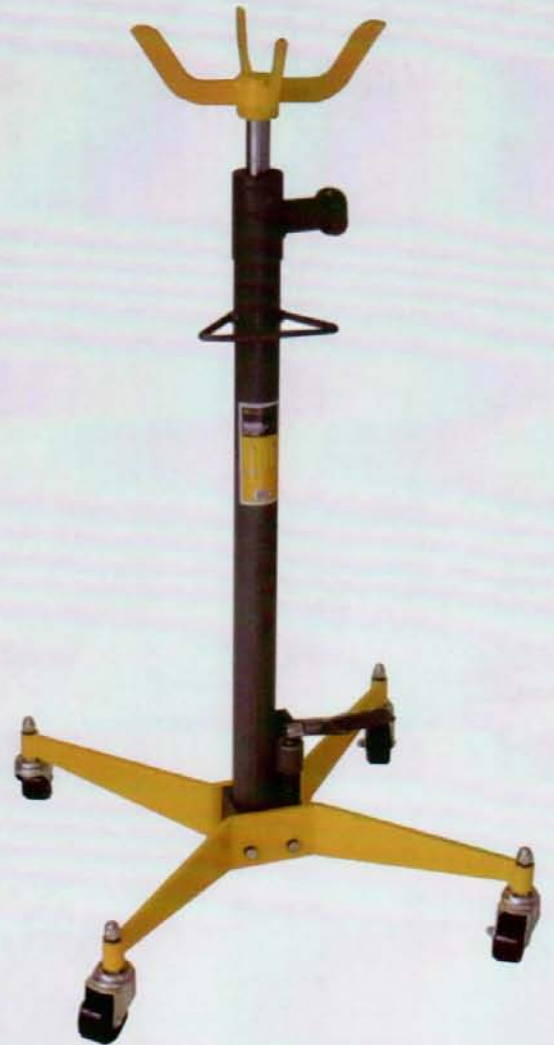
AY - 5 TN GT