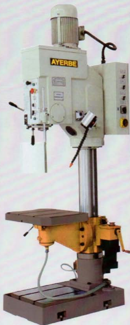
AY - 45 TC-RF

Con interruptor puesta en marcha intempestiva / With micro and magnetic switch / Muni d'interrupteur magnétique de sécurité. Columna con corredera / Column with teeth / Colonne Coulissée Motor estriado / Flanged motor / Moteur Strié