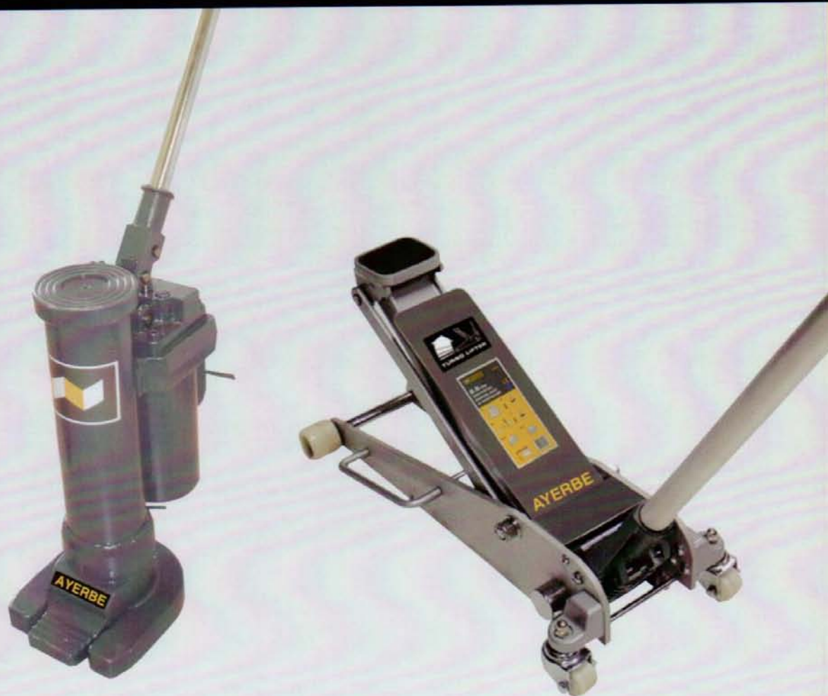
AY - 10 TN