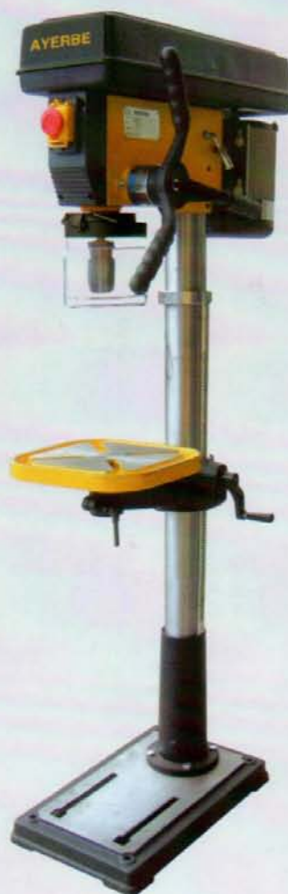
AY - 25 - TC

Con interruptor puesta en marcha intempestiva / With micro and magnetic switch / Muni d'interrupteur magnétique de sécurité. Con protector portabrocas / With chuck guard / Avec protection porte-foret Columna con corredera / Column with teeth / Colonne Coulissée Motor estriado / Flanged motor / Moteur Strié