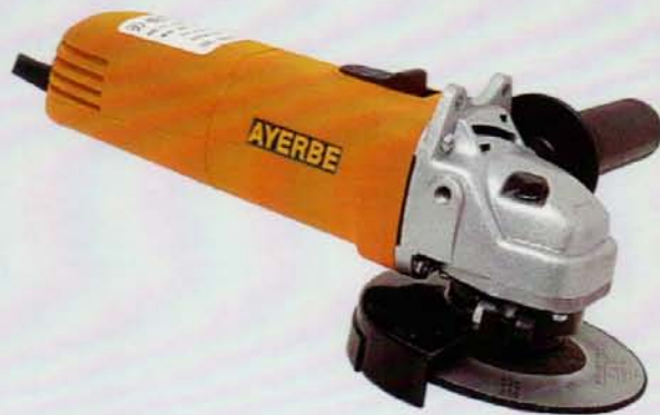
AY - 350 - TR