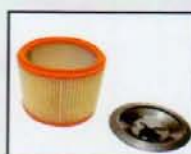
FILTRO CARTUCHO CON DISCO BLOQUEO CARTRIDGE FILTER WITH BLOCKED DISC FILTRE AVEC DISQUE DU BLOCAGE AY - 3600 - IND y AY - 2400 - IND COD.: 587080