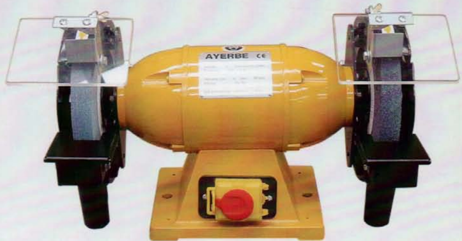
AY - 150 PROF