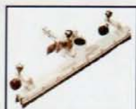
BOQUILLA FIJA POLVO FUNCION BARREDORA FIXED DUST TOOL SWEPPER FUNCTION SACEUR DU POUSSIERE FONCTION BALAYEUSE AY - 3600 y AY - 1200 COD.: 587050