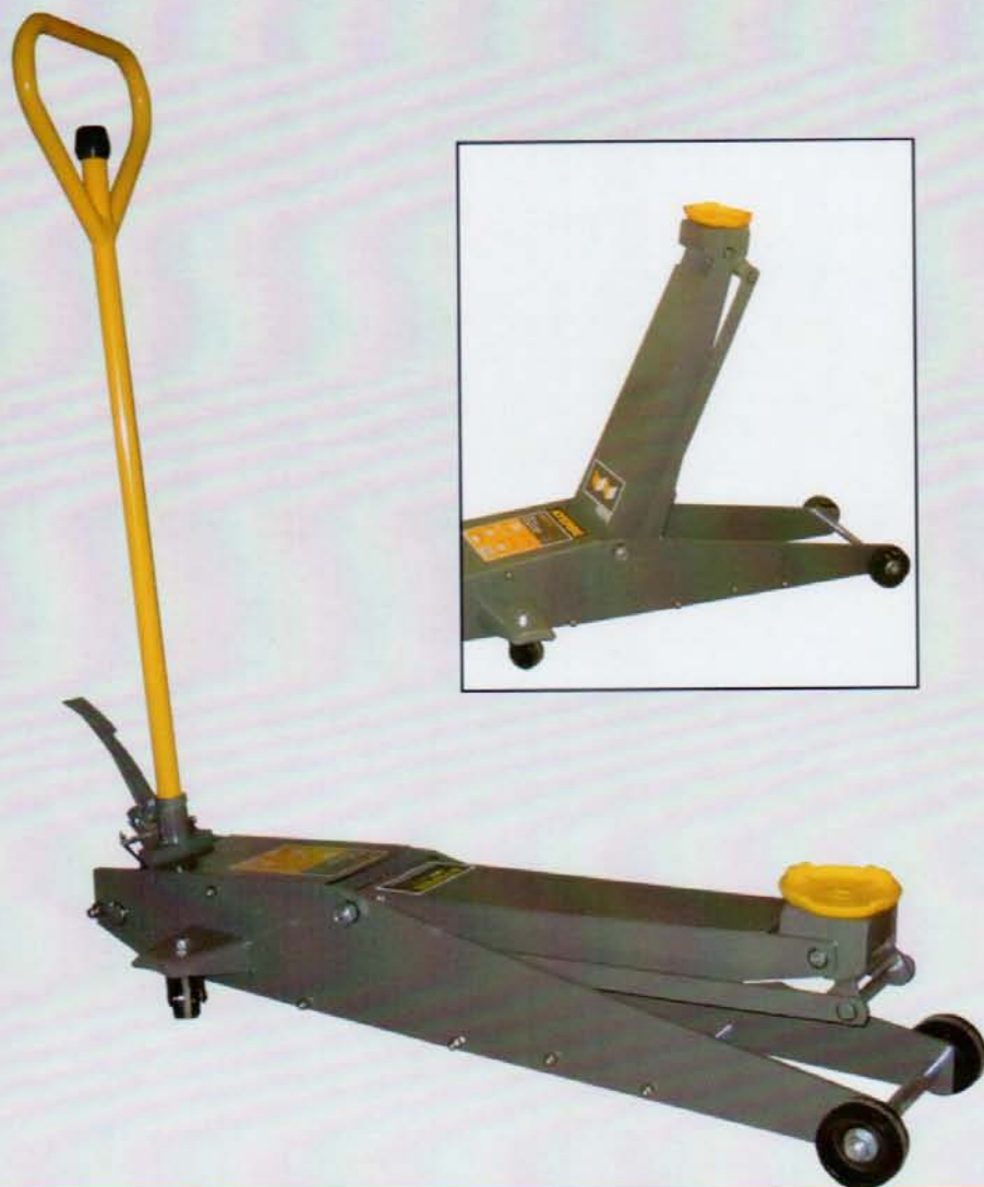
AY - 2 TN PLG

Válvula de seguridad por sobrecarga / Security valve for overweight / Valve Sécurité pour Surcharge. Sistema de descenso controlado / Downed regulation system / Système descente contrôlée.