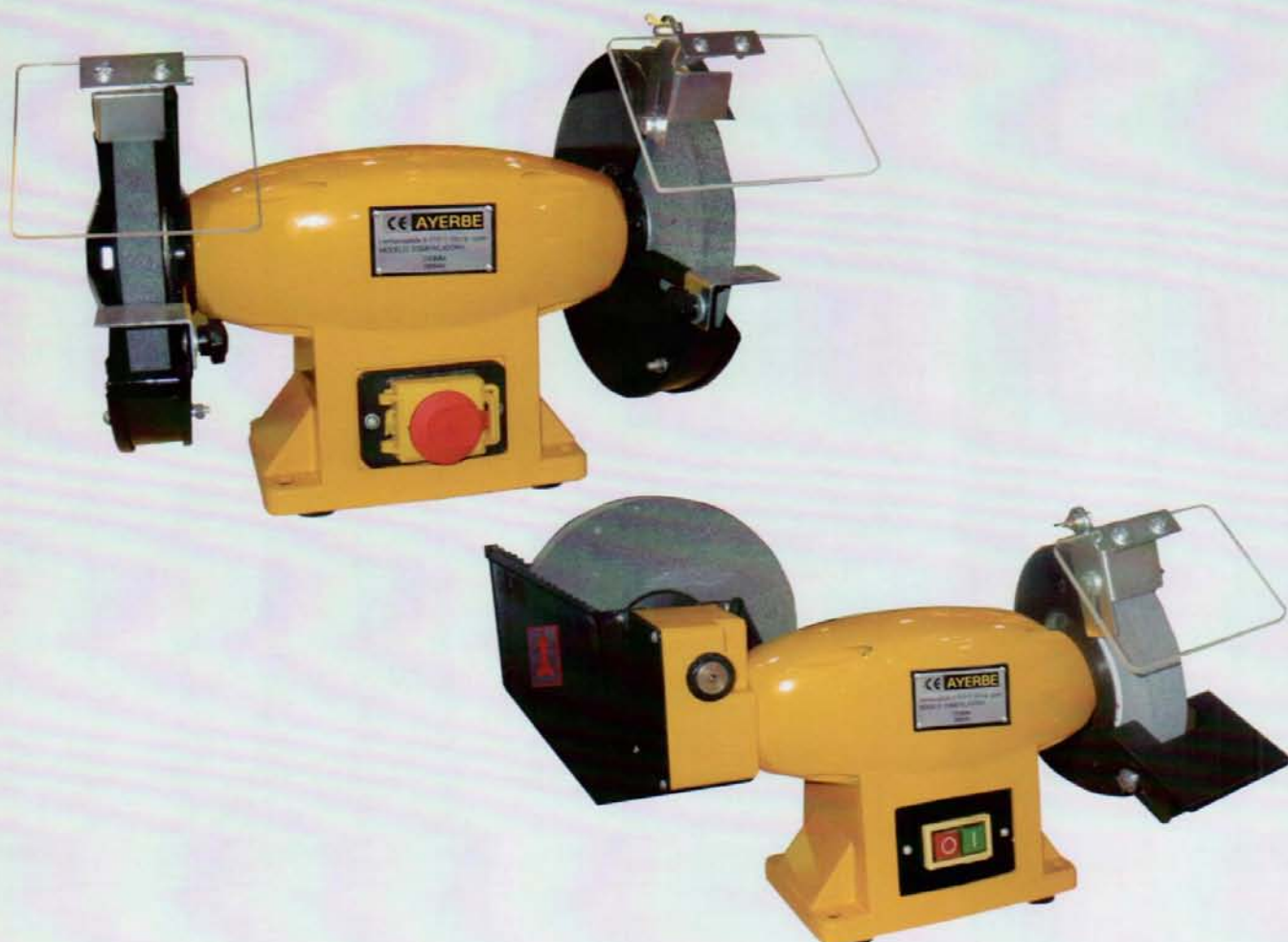
AY - 150 E