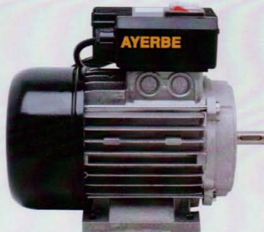
AY - 1500 MN