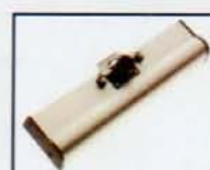
BOQUILLA FIJA COMBINADA FUNCION BARREDORA FIXED COMBI TOOL SWEPPER FUNCTION SACEUR DU COMBINE FONCTION BALAYEUSE AY - 3600 y AY - 1200 COD.: 587090