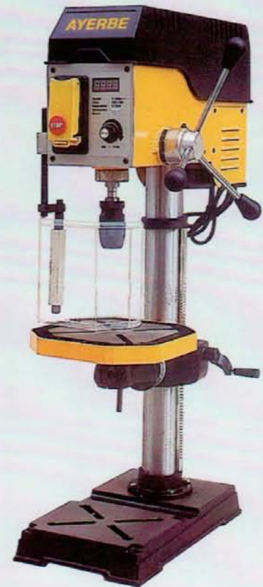
AY - 38 MD