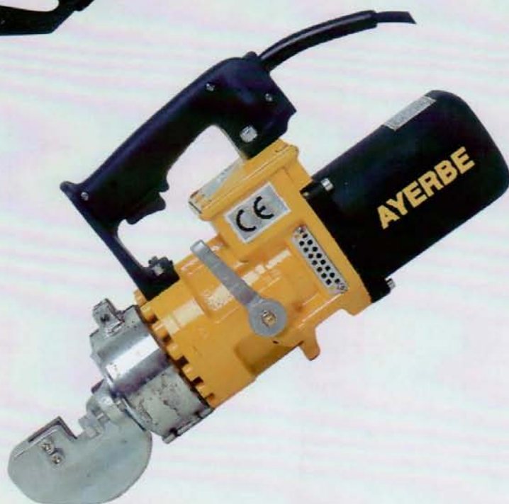
MU - 14