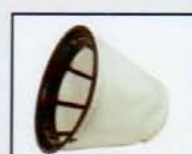
KIT FILTRO POLIESTER POLYESTER FILTER KIT KIT FILTRE DU POLYESTER AY - 3600 - IND y AY - 2400 - IND COD.: 587060