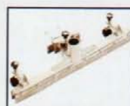
BOQUILLA FIJA LIQUIDOS FUNCION BARREDORA FIXED WATER TOOL SWEPPER FUNCTION SACEUR D'EAU FONCTION BALAYEUSE AY - 3600 y AY - 1200 COD.: 587070