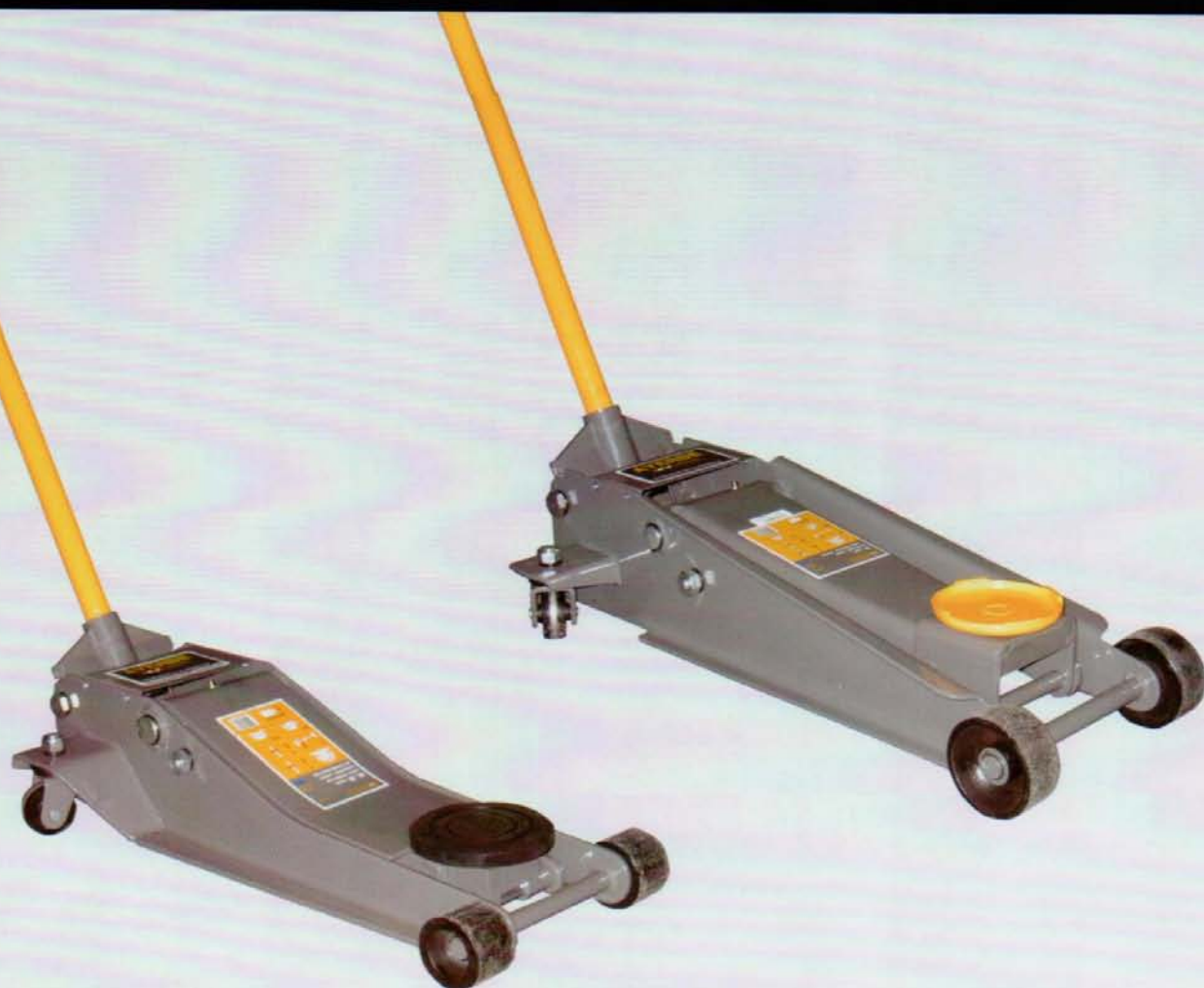
AY - 2'5 TN GBP