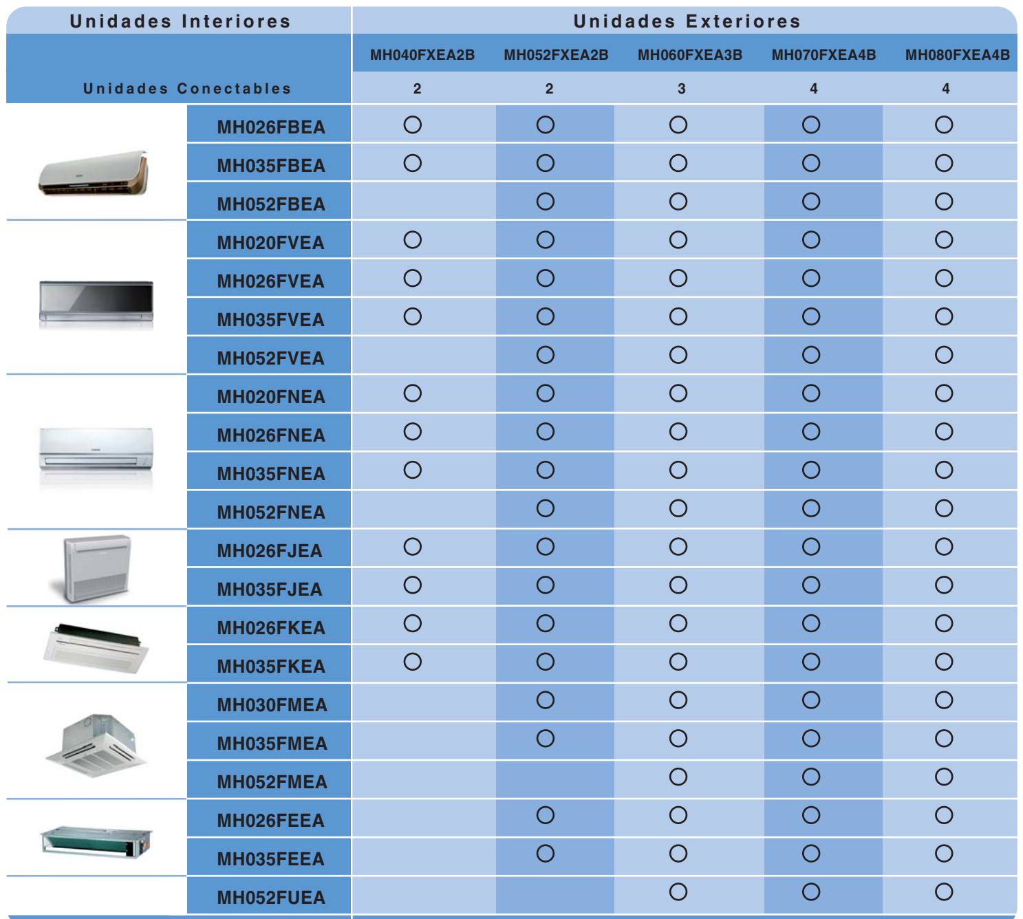
TABLA DE COMPATIBILIDADES