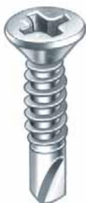
851/1 TZ Cruz Philips Punta Atornillador 1/4"x25