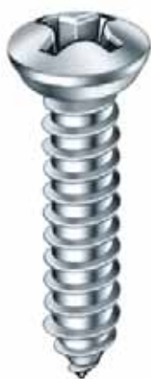
851/1 TZ Cruz Philips Punta Atornillador 1/4"x25