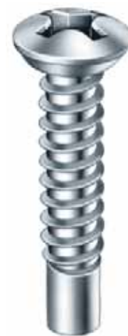
851/1 TZ Cruz Philips Punta Atornillador 1/4"x25