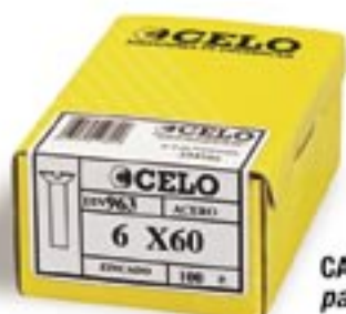
CAJA INDUSTRIAL para grandes consumidores