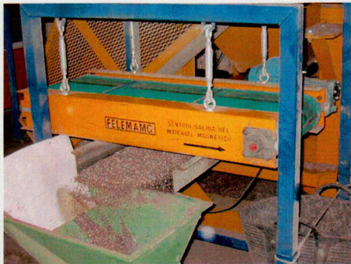
SEPARADORES MAGNÉTICOS OVERBAND DE NEODIMIO