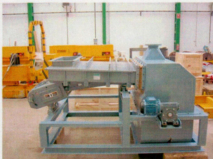
MÁQUINAS SEPARADORAS MAGNÉTICAS ESPECIALES