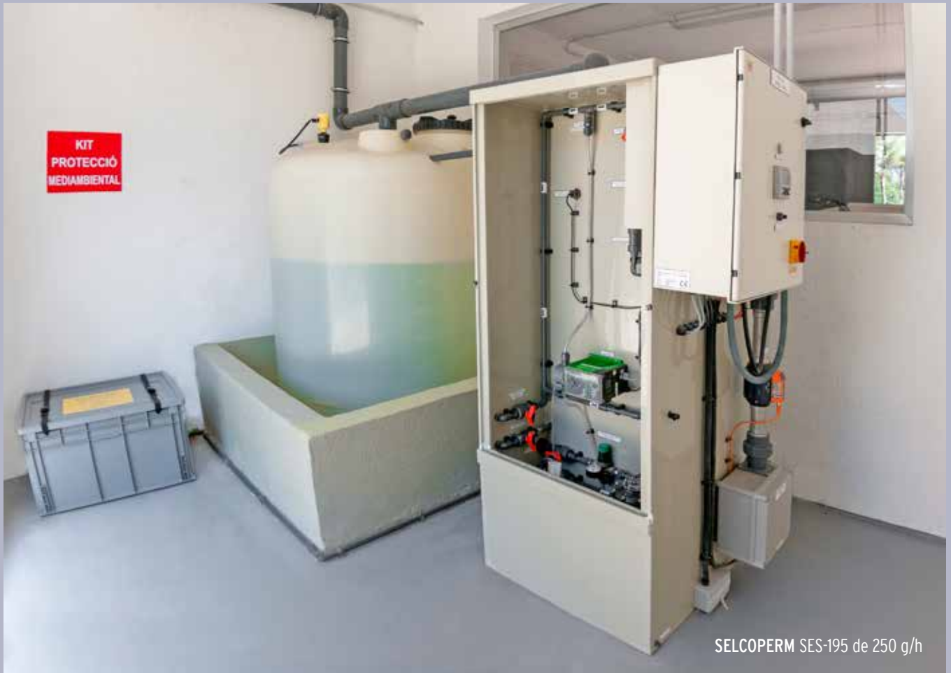
SELCOPERM SES-195 de 250 g/h