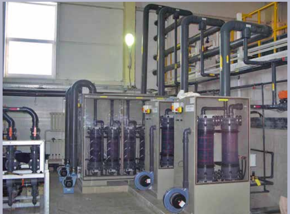
Instalación de electrocloración Selcoperm hasta 900 kg/día