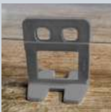
BASE – CLIP