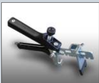
ALICATE – TOOL