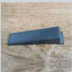
CUÑA – WEDGE