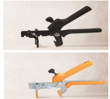
Tenazas: Plástico o Hierro