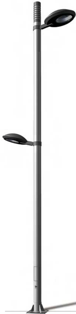
TARRACO KT DRA-2504 R