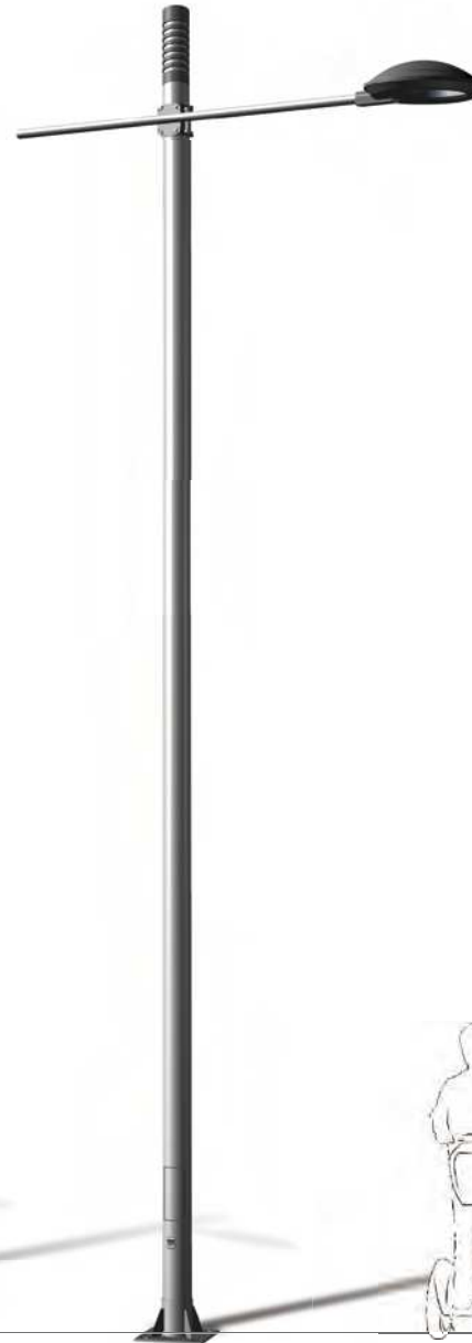
TARRACO KL DRA-2503 P