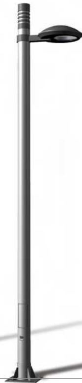
TARRACO K DRA-2506 P