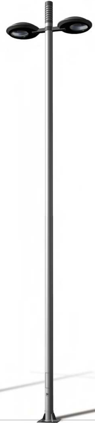
TARRACO K DRA-2502 D